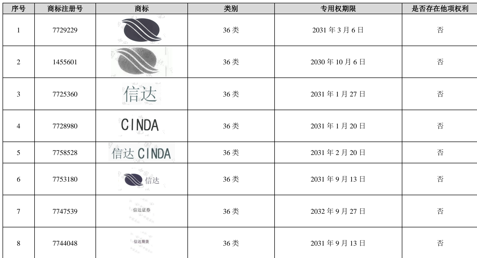
附件 11：中国信达授权信达证券使用的中国境内的商标