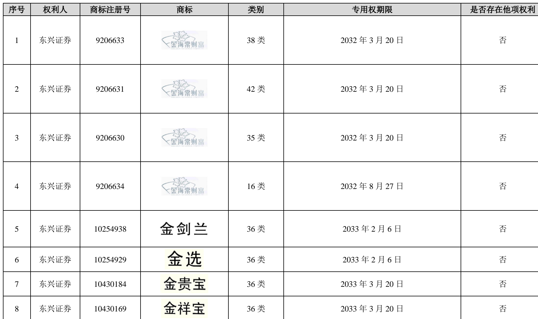
附件 9：东兴证券及其境内控股子公司在中国境内拥有的注册商标