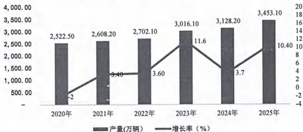
2020年至2025年汽车产量及增长率

2020年至2025年各期汽车销量分别完成 2,531.10 万辆、2,627.50 万辆、2,686.40 万辆、3,009.40 万辆、3,143.60 万辆和 3,440.00 万辆，同比分别增长-1.9%、3.8%、2.2%、12.0%、4.5%、9.4%。