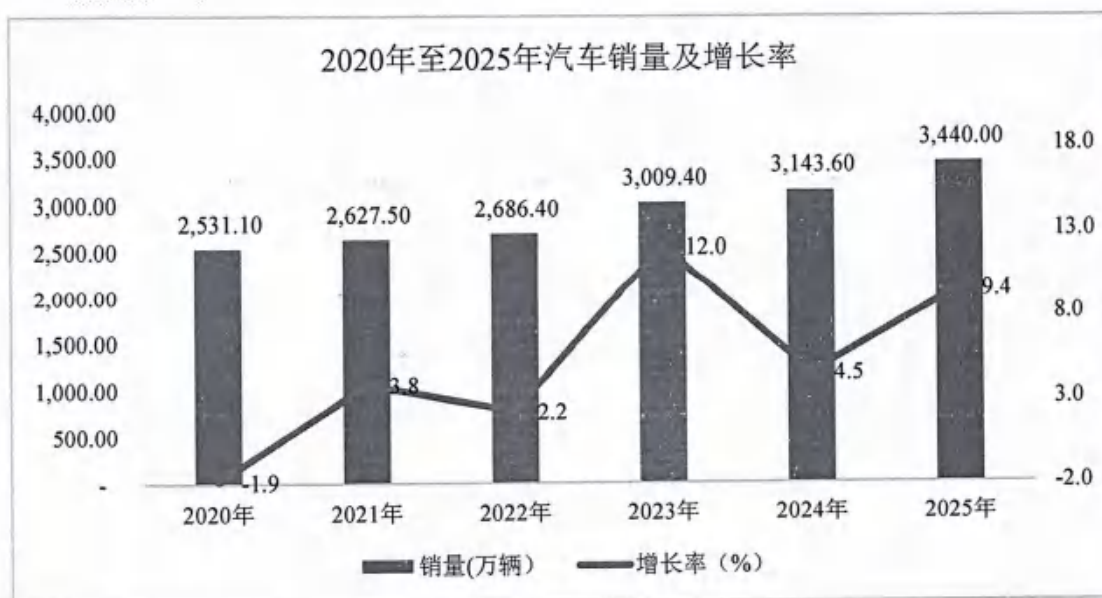
2020年至2025年汽车销量及增长率

2020年至2025年各期汽车销量分别完成 2,531.10 万辆、2,627.50 万辆、2,686.40 万辆、3,009.40 万辆、3,143.60 万辆和 3,440.00 万辆，同比分别增长-1.9%、3.8%、2.2%、12.0%、4.5%、9.4%。