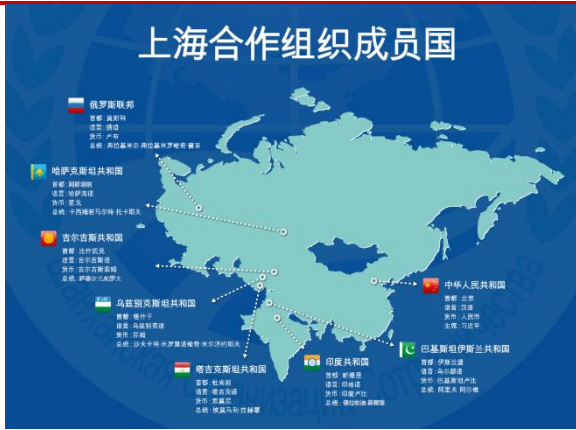
图 3 上海合作组织地图

从合作组织能够看到我国外交布局的走向。在中俄联合声明中的合作机构部分，首先提到的是上合组织以及金砖五国。上合组织以我国城市为名、由我国主导成立的综合性区域组织，其设立宗旨一方面是促进各成员国之间多领域的有效合作，另一方面则是保障地区安全、维护国际秩序。对上合组织的额外重视，体现我国对形成由自己主导的核心圈层的需求。从地图上能看到合作组织主要集中在欧亚地区周边地带。但是今年，伊朗将正式加入上合组织；3月29日，沙特阿拉伯内阁也批准了加入上合组织的决定。这象征着我国外交圈层的一大突破，而上合组织其经济、政治的双重属性，让我国能更方便的参与到有关中东的事务上来。能看到我国的全球战略布局，跨出了很大的一步。