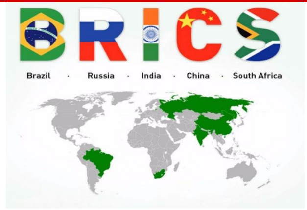
图 4 金砖国家地图