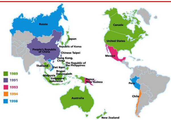
图 6 亚太经合组织成员