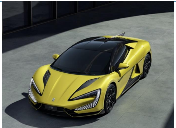
图表7：仰望 U9 外观