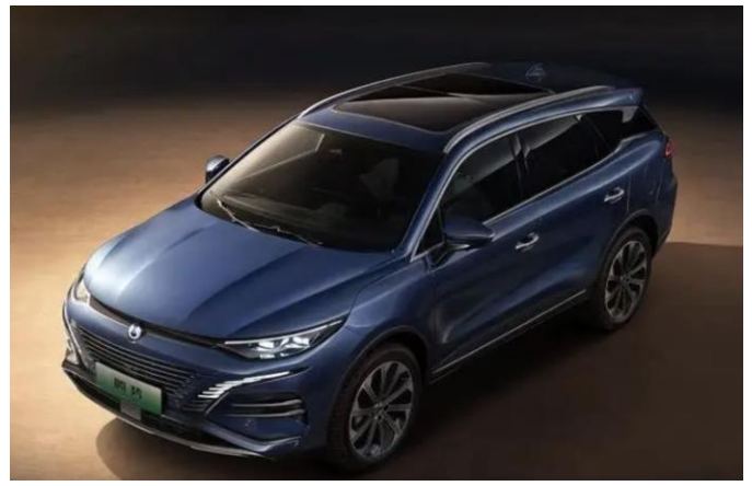
图表9: 腾势 N8 外观