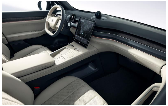
图表36: 蔚来 ES8 内饰图