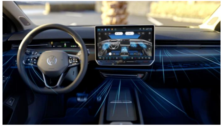
图表44: 大众 ID.7 内饰图