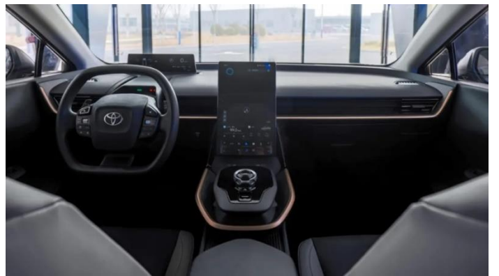
图表46: 丰田 bz3 内饰