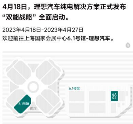
图表30：理想在上海车展位置布局情况

理想首款纯电车型：基于 Whale 平台研发的 MPV。1) 搭载宁德时代 4C（充电倍率）麒麟电池；2) 搭载 800V 高压平台，充电 10 分钟，续航 400km；3) 新一代高通骁龙 8295 芯片。W01 作为首款车型将担任纯电产品矩阵的航母，理想未来将推出 5 艘舰船（基于 Shark）平台，合计 6 款车型打造产品矩阵。