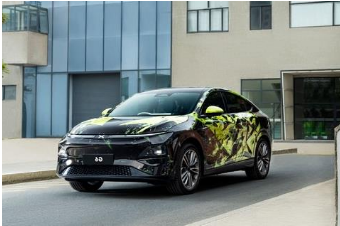
图表39: 小鹏 G6