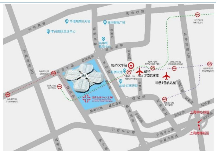
图表2：国际会展中心附件交通