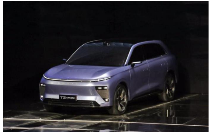
图表23: 星途星纪元 STERRA ET 外观