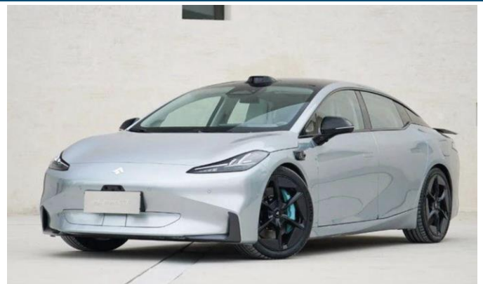
图表27: 埃安 Hyper GT 外观