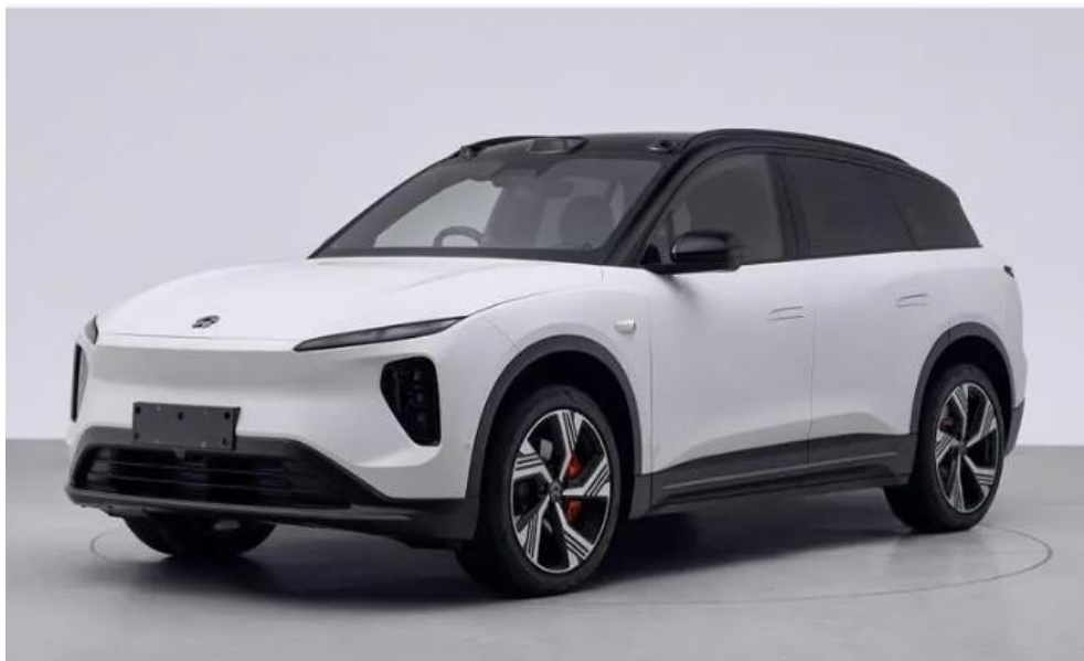
图表34: 新款蔚来 ES6 外观

动力系统: 双电机四驱版, 前后电机功率分别为 150kW、210kW; 搭载 75/100/150 kWh 电池包, CLTC 续航里程达到 465/605/900km。