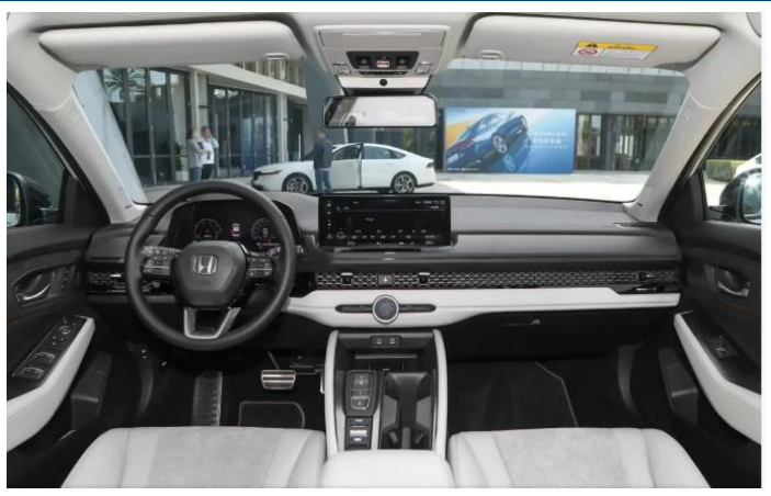
图表48: 雅阁 11 代内饰