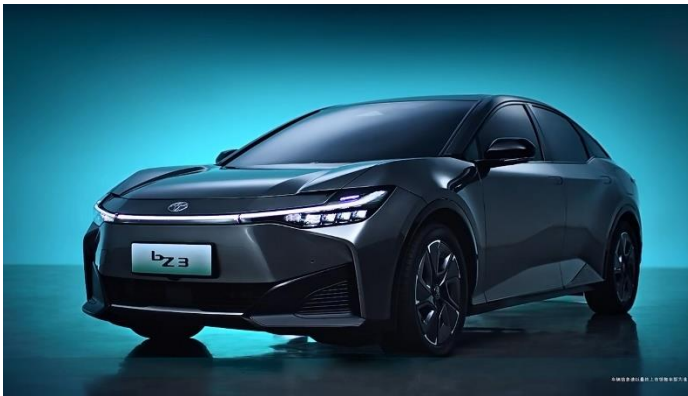
图表45: 丰田 bz3 外观

动力系统: 搭载弗迪单电机、比亚迪磷酸铁锂电池组, 提供 49.92kWh、65.28kWh 两个版本, CLTC 纯电续航里程分别为 517km、616km, 30%-80%充电仅需 27 分钟, 百公里加速 7.8s。