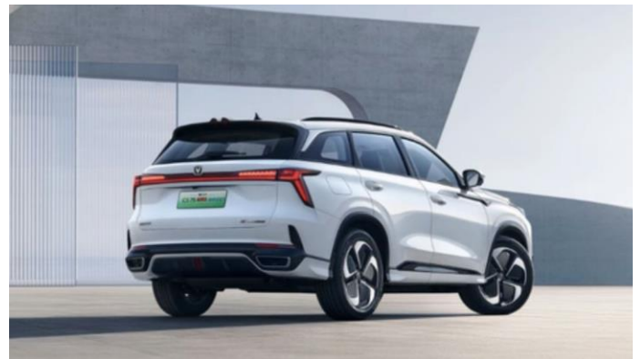
图表21: 长安 CS75plus 智电 iDD 外观 (背面)