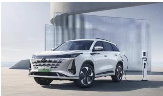
图表20: 长安 CS75plus 智电 iDD 外观 (正面)

1) 深蓝 S7 定位为中型 SUV, 将会有增程和纯电两种动力模式可选。车身尺寸 4750/1930/1625mm, 轴距 2900mm。其增程版, 电机总功率 175kW, WLTC-160km。纯电版, 提供 160kW 和 190kW 两版本, 续航为 520 和 620 公里, 使用三元锂电池。售价 17.19 万元起, 6 月正式上市。