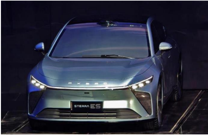
图表22: 星途星纪元 STERRA ES 外观