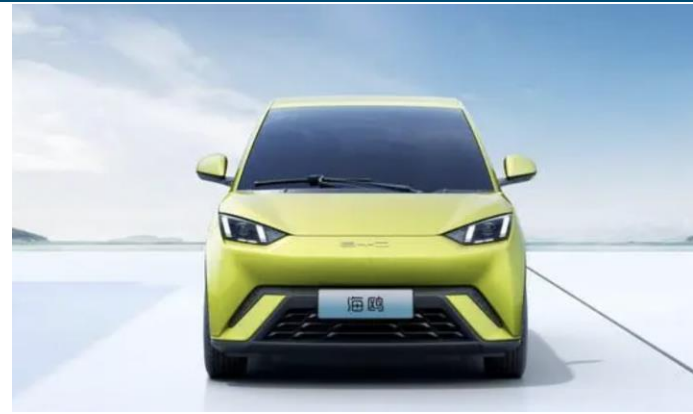
图表4：比亚迪海鸥外观（正面）

本次上海车展预计比亚迪将带来海鸥、仰望 U8/U9、腾势 N7/N8 五款车型。其中海鸥定位低端小型车冲量，仰望/腾势品牌定位豪华/高端，将进一步完善比亚迪产品矩阵：