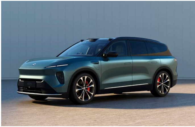
图表35: 蔚来 ES8 外观