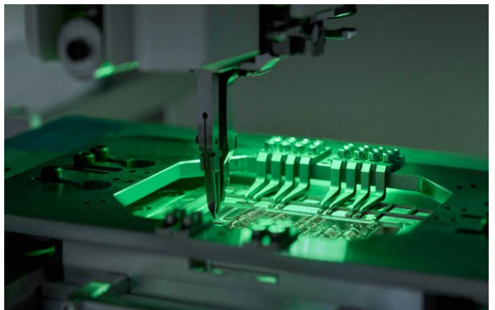
图表31：理想自研 800V 快充技术