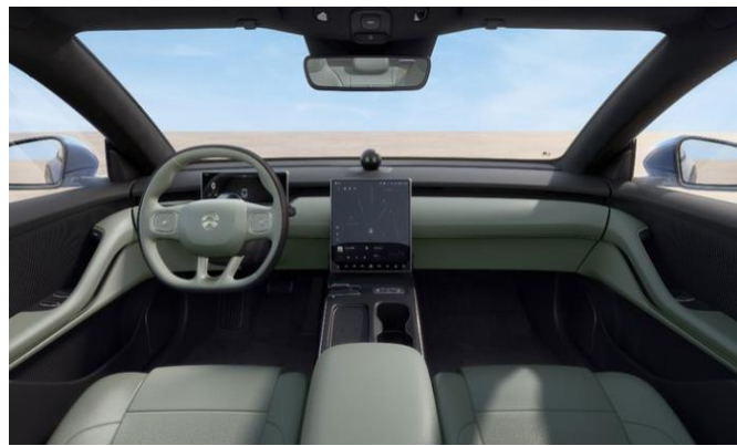
图表33: ET5 旅行版内饰(预计)