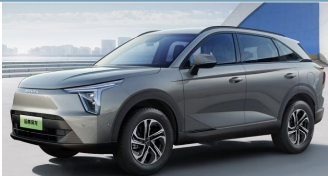
图表12: 哈弗枭龙外观

1) 魏牌蓝山 DHT-PHEV 定位为大中型插混 SUV, 车身尺寸 5156/1980/1805mm, 轴距 3050mm。新车主打六座超大空间, 动力方面搭载 DHT 新能源技术, 四驱双电机, WLTC 纯电续航 180km、综合续航 1200km 以上, 馈电油耗百公里 6.7L, 最大扭矩 933Nm。该车将于 4 月 13 日上市, 预计售价 30-35 万元, 对标理想 L8。