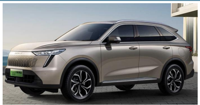
图表13: 哈弗枭龙 MAX 外观