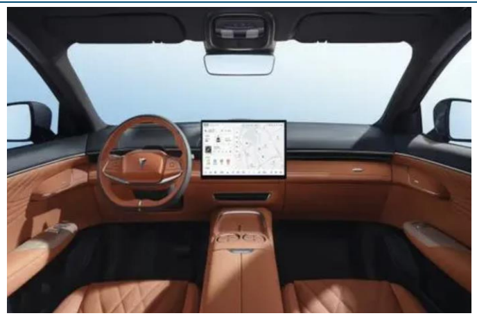
图表19: 长安深蓝 S7 内饰