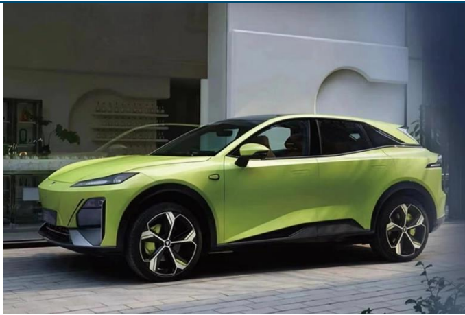
图表18: 长安深蓝 S7 外观