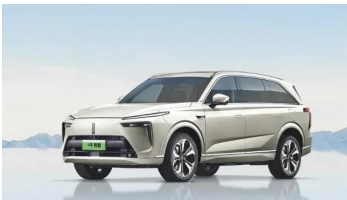
图表10: 魏牌蓝山 DHT-PHEV 外观

长城以“长城智能新能源, 更省更远更安全”为宣言, 着力实现在能源和智能化领域的扁平化、网络化、去中心化的全产业链布局, 体现公司在电动时代的核心竞争力。本次上海车展, 预计长城将带来魏牌蓝山 DHT-PHEV、哈弗枭龙/枭龙 MAX 三款车型, 三款新车均为插混 SUV, 其中枭龙/枭龙 MAX 将搭载长城全新的智能四驱电混技术 Hi4。