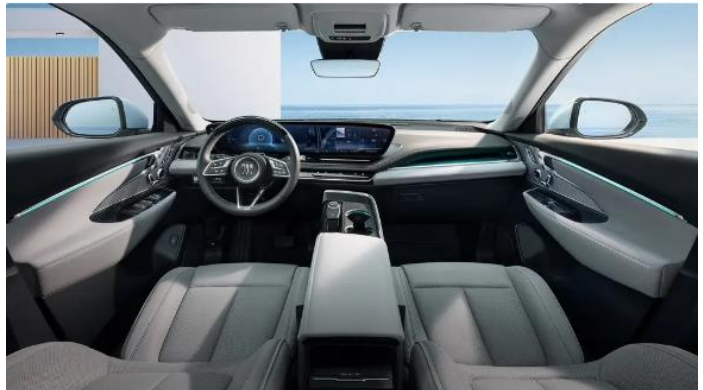
图表50: 别克 E5 内饰