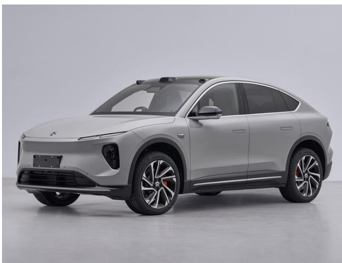
图表37: 蔚来新款 EC6 外观

动力系统: 前后双电机功率 150/210kW; 搭载 50/75/100kWh 电池包, CLTC 续航里程达到 450/495/575/630km。