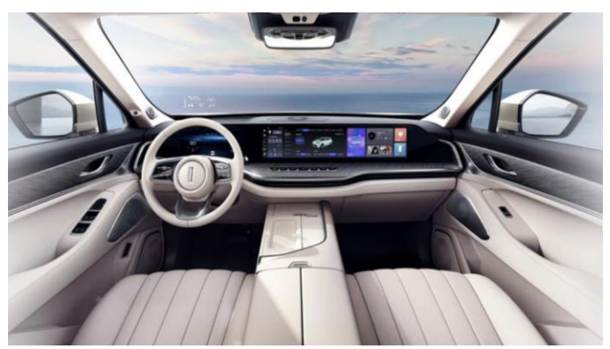
图表11: 魏牌蓝山 DHT-PHEV 内饰