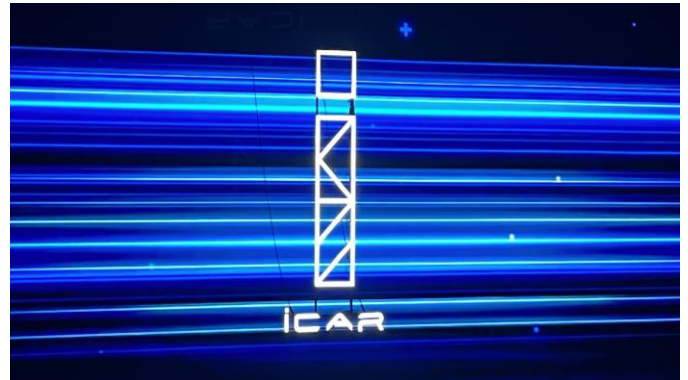
图表25: 奇瑞 iCar 新品牌