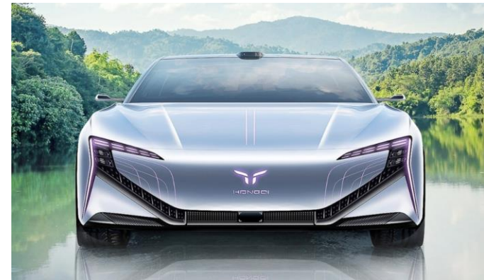
图表28：红旗 E001 外观（正面）

电车中，红旗 E001 有望亮相，该车为旗下子品牌“红旗新能源”的首发车型，定位中型轿车。新车基于 FMEs 平台架构开发，续航可达 1000 公里，支持 30kW 无线充电，并可实现同时充、换电，零百加速 3 秒。预计售价 20 万以上，下半年发布。