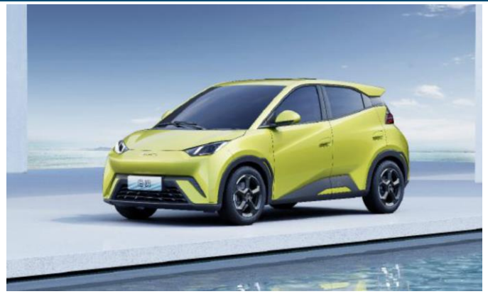
图表5：比亚迪海鸥外观（侧面）