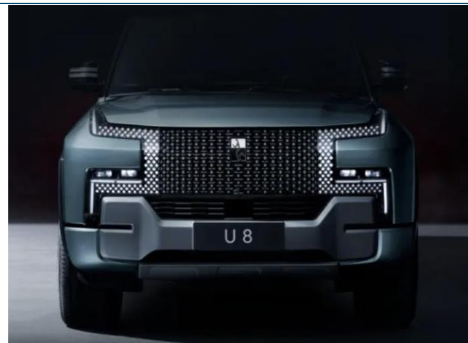
图表6：仰望 U8 外观

1) 比亚迪海鸥定位为小型车，基于 e 平台 3.0 技术打造。车身尺寸 3780/1715/1540mm，轴距 2500mm；电池容量 55 KWh/70 KWh，续航最高 400km。前日该车型已于官微公布外观图，预计售价 8-10 万元。预计将与五菱缤果、零跑 T03 共同竞争小型车市场。