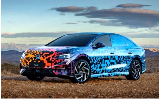
图表43: 大众 ID.7 外观