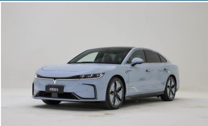
图表26: 岚图追光外观

1) 东风汽车: 岚图追光或再亮相。追光定位为中大型轿车, 是岚图旗下的首款轿车, 车型尺寸 5088/1970/1515 mm, 轴距 3000 mm。新车标配双电机四驱系统, 系统总功率 375kW。提供 82/109 kWh 两款电池, 对应纯电续航里程分别为 580/730km。并搭载 ESSA+SOA 智能电动仿生体。售价 32.29-43.29 万, 4 月交付。