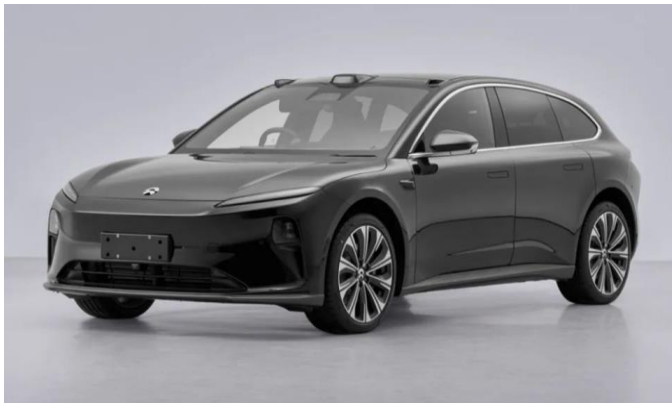
图表32: ET5 旅行版