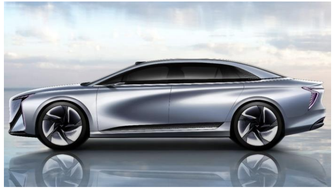
图表29：红旗 E001 外观（侧面）