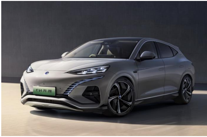
图表8: 腾势 N7 外观