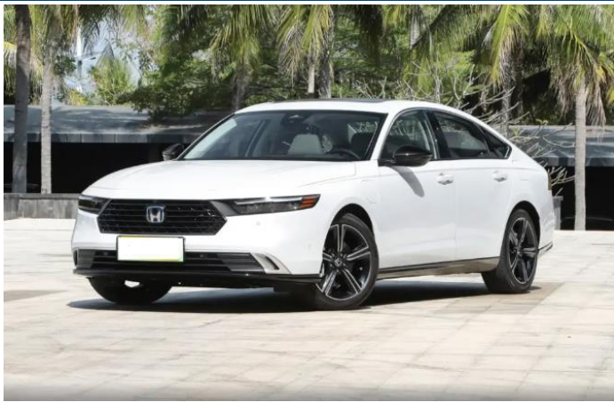
图表47: 雅阁 11 代外观