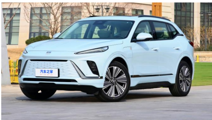
图表49: 别克 E5 外观

动力系统: 艾维亚四驱版采用前永磁同步、后感应异步的电机布局, 前电机最大功率 143kW, 峰值扭矩 305 Nm, 后电机峰值功率 68kW, 峰值扭矩 160Nm; CLTC 工况下最大续航里程 620km。