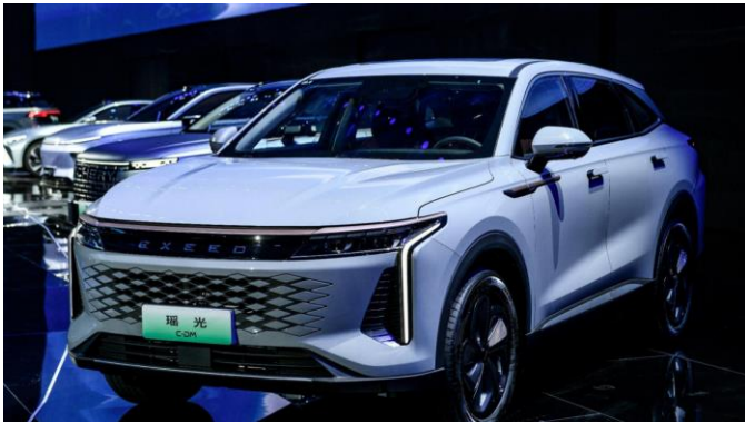
图表24: 星途瑶光 C-DM 外观