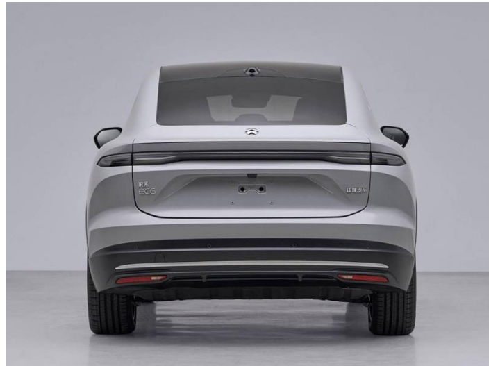
图表38: 蔚来新款 EC6 外观