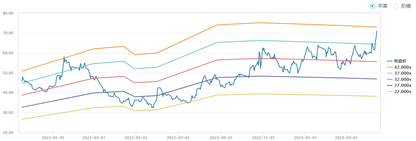
图 1：新点软件上市以来 PE-Band