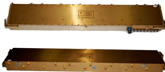
图 2 九州迪飞 14 路数字 TR 组件产品