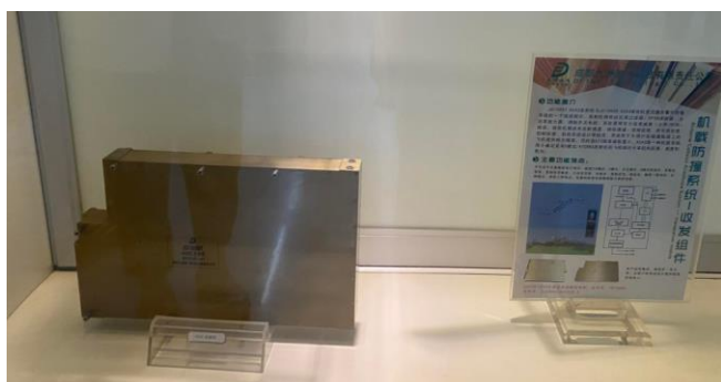
图 1 九州迪飞自主研发的机载防撞系统收发组件产品

成立 18 年来聚焦微波射频，在飞机防撞、雷达等领域实现关键突破。根据成都商报，公司成立以来聚焦微波射频，目前已从微波射频组件和模块向前端 CBB（共通性建构基础）和芯片延伸，同时开展整机、系统业务，产业链更加完整。此外，公司在飞机防撞、雷达等领域实现关键突破，其自主研发的多通道机载综合防撞设备实现了多模式发射、任意频谱产生、脉冲快速响应、收发自适应校准等技术。未来九州迪飞立足微波射频主业，有望扩展更多的场景应用，开辟更多的增长曲线。