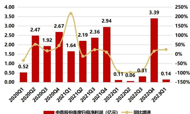
图2：2023Q1 归母净利润为 0.14 亿，同比增长 24.37%