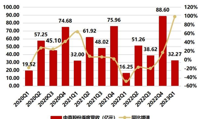
图1：2023Q1 营业收入 32.27 亿元，同比增长 98.52%