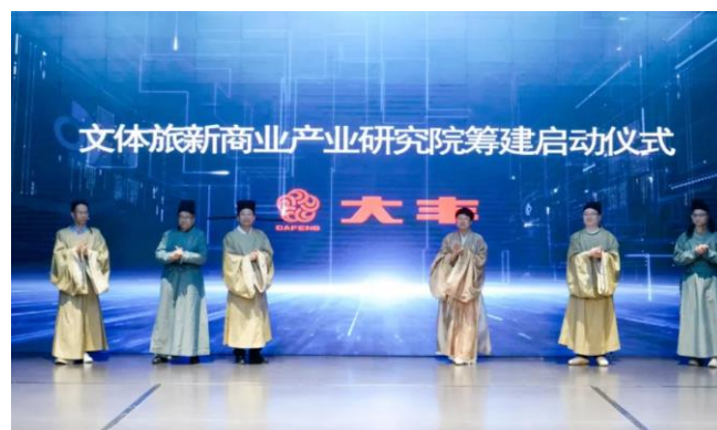
图 2：文体旅新商业产业研究院筹建启动仪式