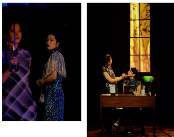
图 6：民国悬疑音乐剧《蝶变》开启全国巡演第一站