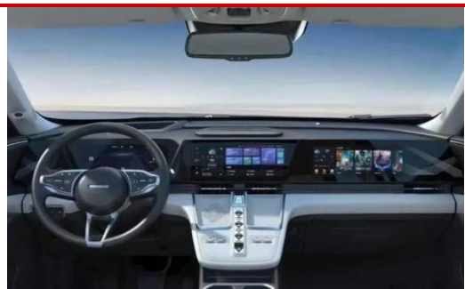
图 2 哈弗枭龙 Max 车内空间