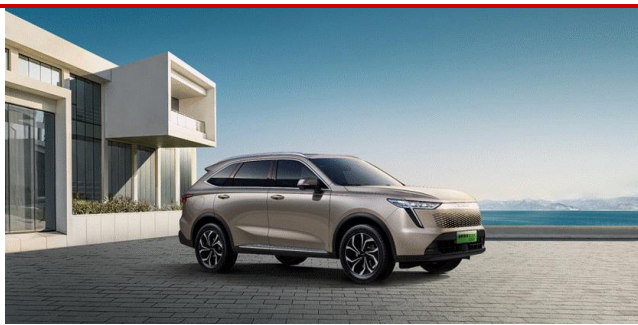
图 1 哈弗枭龙 Max 外观