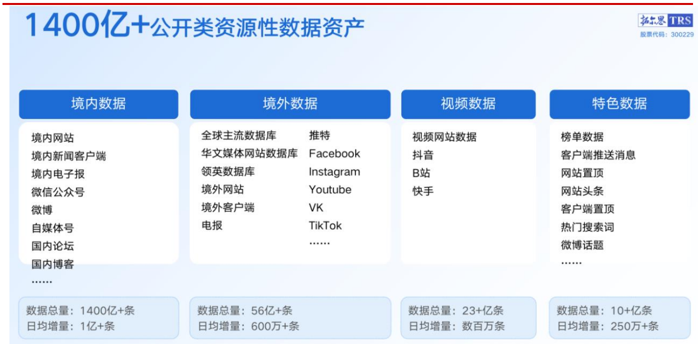
图表 5 拓尔思数据资产