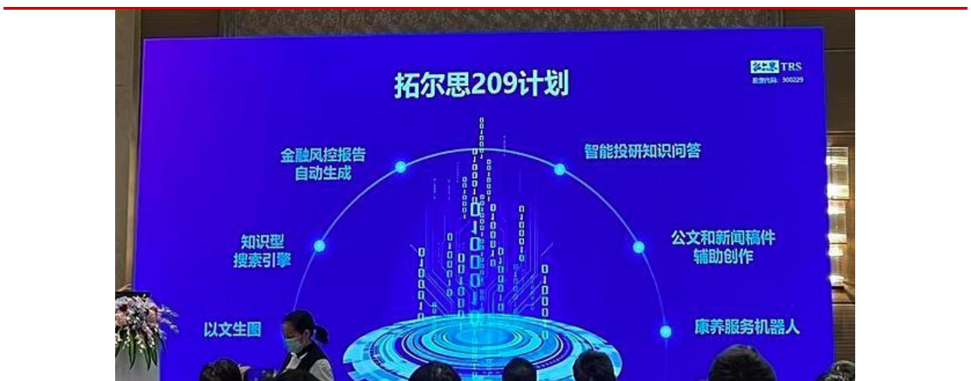
图表 4 拓尔思 209 计划

根据公司 4 月 26 日投资者关系活动记录表显示，2023 年开年公司启动了“209”工程，力争在短期内推出 trsGPT 及基于 trsGPT 生成的系列 AIGC 产品，目前相关产品研发及测试工作正在进行中。公司正在研发的 trsGPT 是在基础大模型之上进行训练和精调，研制面向政务、金融、媒体三个行业的专业大模型，提供公文辅助写作、投研自动报告生成、智能投研问答、新闻资讯知识型搜索、以文生图配稿等服务。关于 trsGPT 的预计推出时间，公司表示计划在今年上半年推出。