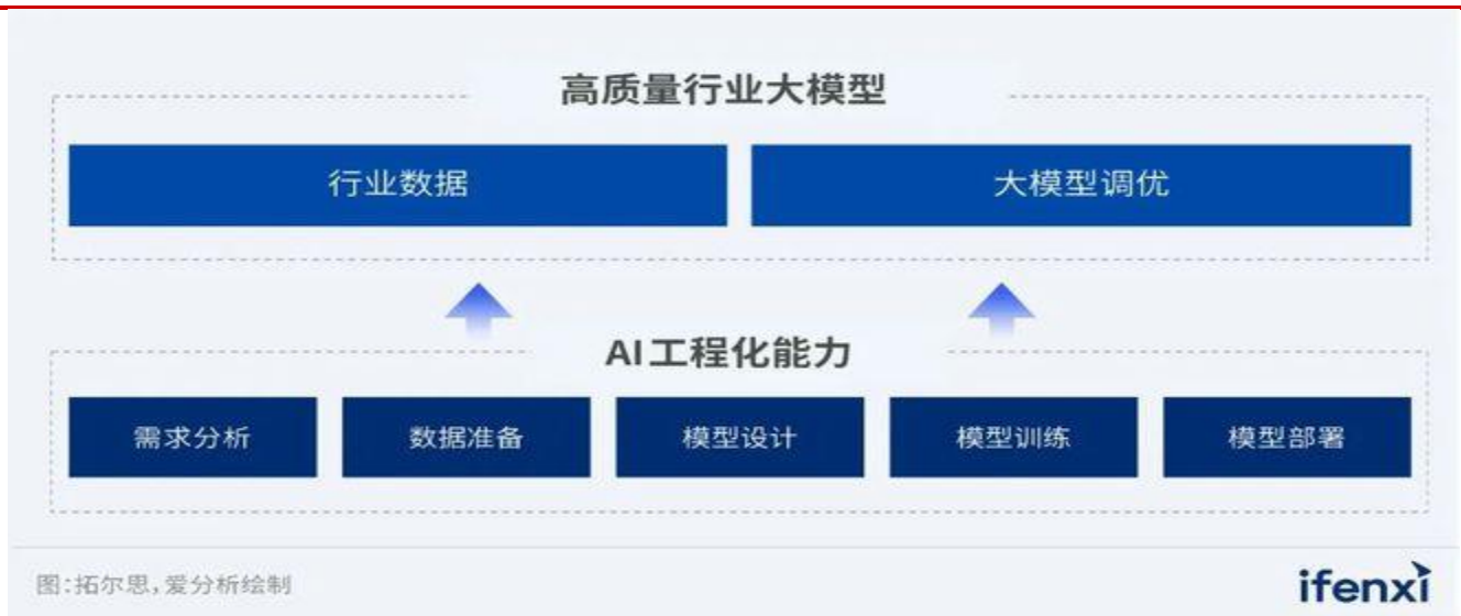
图表 1 AIGC 应用落地关键示意图

其中，行业数据指的是在金融、传媒、政府、医疗等特定领域内的公开和非公开的知识、经验和数据。丰富的行业数据可以迅速提高产业大模型的学习能力，并将其与后来者的差距持续拉大，为厂商提供先发优势。