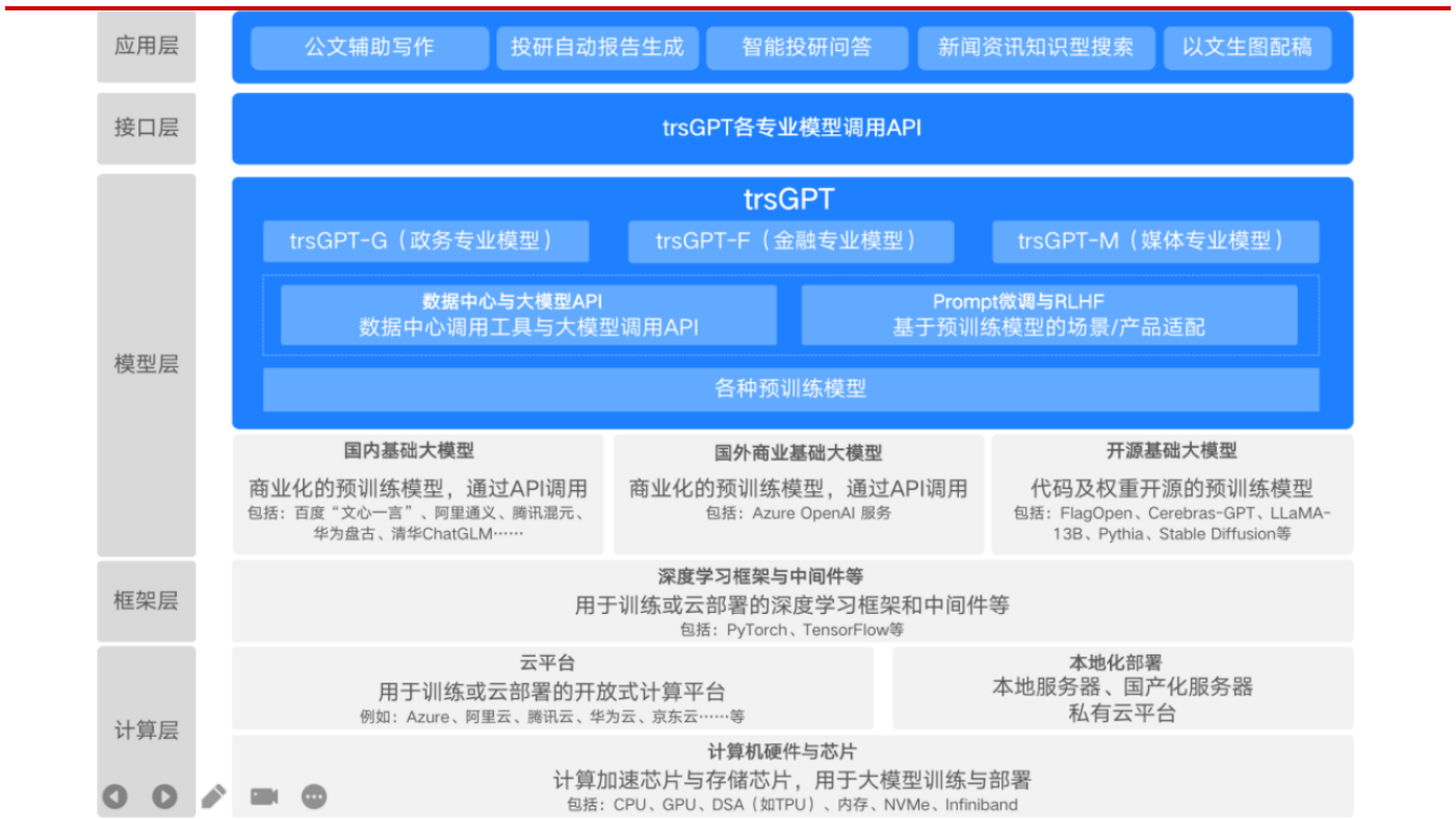
图表 3 trsGPT 技术栈