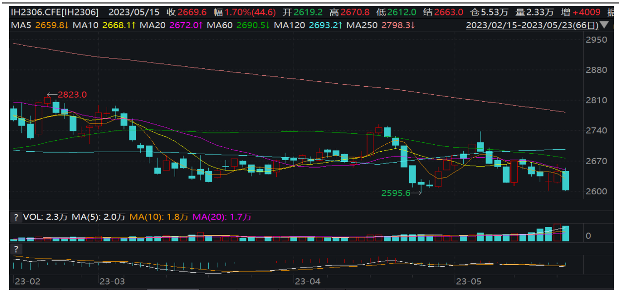
图表 3: IH2306 合约价格