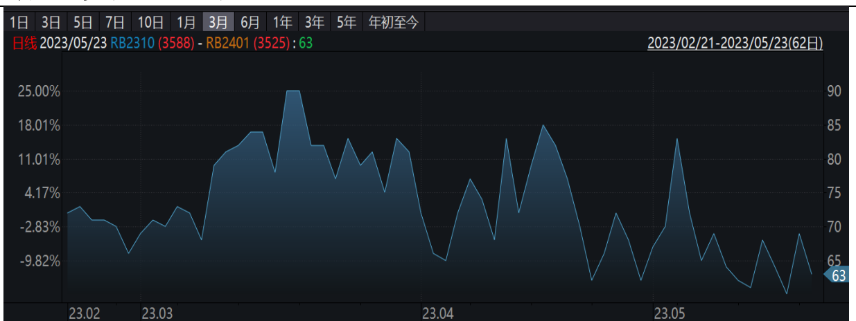
图表 2：多螺纹 2310 空螺纹 2401