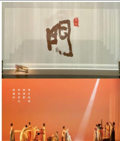
图 8：民国悬疑音乐剧《蝶变》开启全国巡演第一站