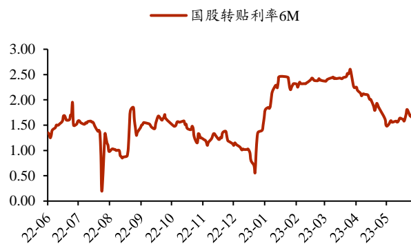
图2: 4、5月国股转贴利率震荡下行