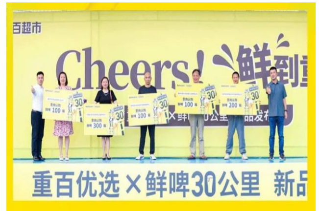
图 2：“鲜啤 30 公里” 与重百开启战略合作