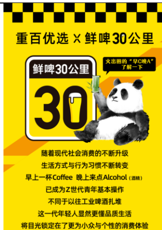
图 1：“鲜啤 30 公里” 联名重百优选