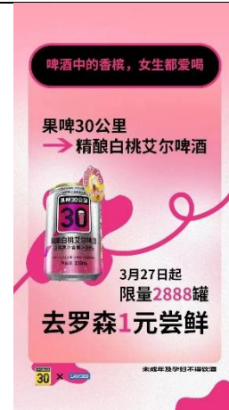
图 6：“鲜啤 30 公里”入驻罗森便利店