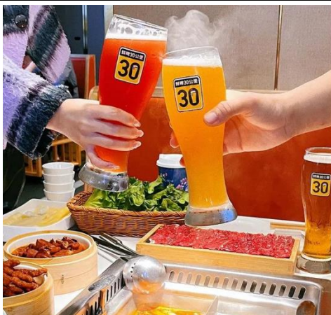
图 7：“鲜啤 30 公里”入驻巴邑火锅