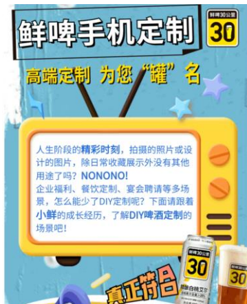
图 3：“鲜啤 30 公里” 定制罐业务