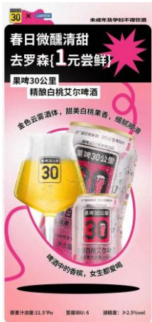
图 5：“鲜啤 30 公里”入驻罗森便利店