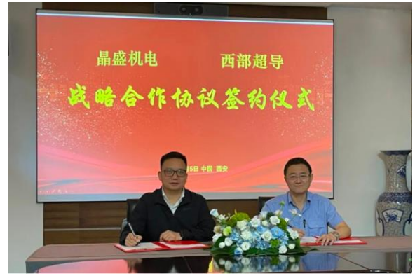
图 3：与西部超导签战略合作协议,完善上游超导磁场布局