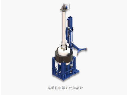
图 2：公司第五代单晶炉示意图