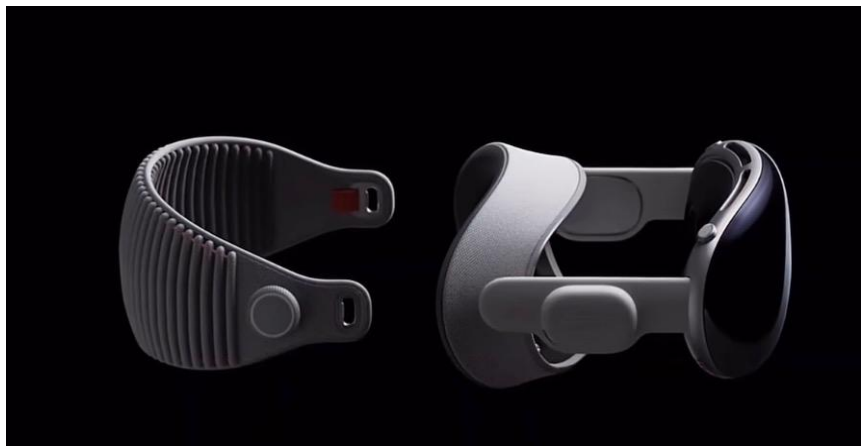
图 7：Vision pro 机身设计