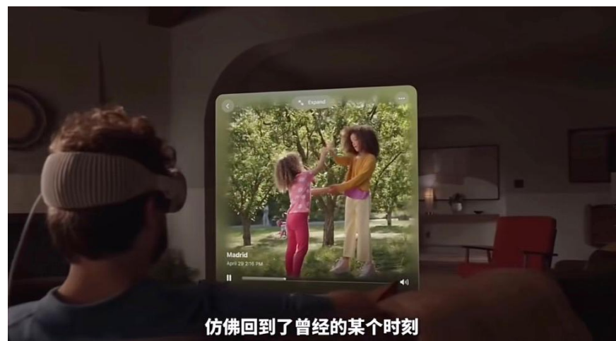
图 5: Vision pro 3D 相机