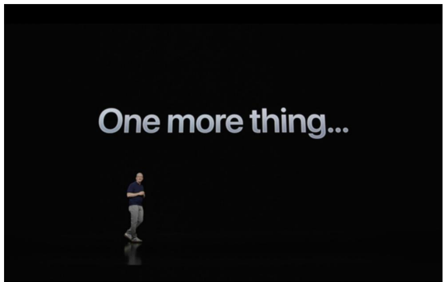
图 1: 2023 年 6 月 6 日苹果 MR 产品 VisionPro 发布会