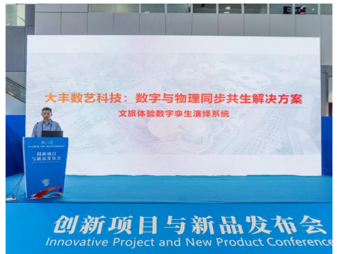
图 4：大丰多媒体数字孪生控制系统重磅发布