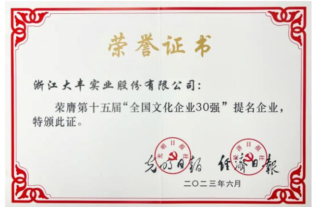
图 2：大丰再获“全国文化企业30强”提名