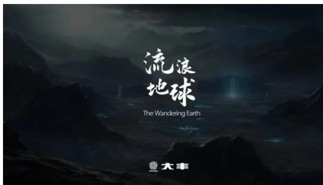
图 10：大丰文化牵手《流浪地球》