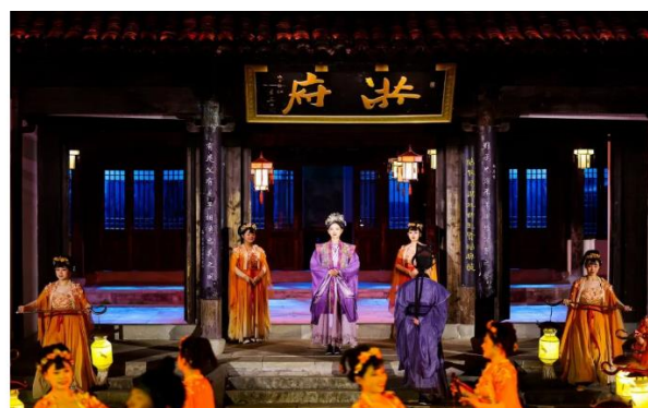
图 14: 《今夕共西溪》