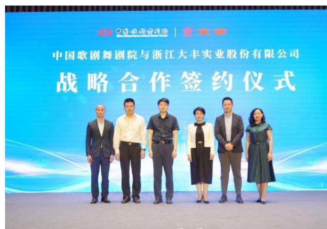
图 6：与中国歌剧舞剧院签署战略合作协议