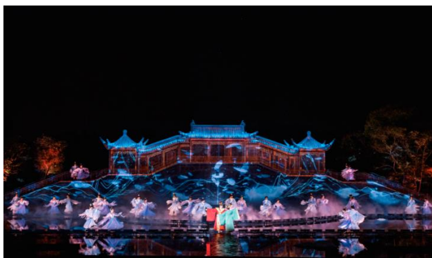
图 13: 《今夕共西溪》

《今夕共西溪》积极延伸“演艺+”产品链，在演出前增加由剧情延伸的宋韵游园，让游客在看戏之前，提前达到沉浸式的“入其梦、触其行、感其情”。打造多元化运营的“宋韵杭式生活体验基地”，构建一个有文化、有品位、丰富而多样的生活方式形态，促进宋韵杭式生活向参与化、互动化、情景化、趣味化等体验式方向发展。