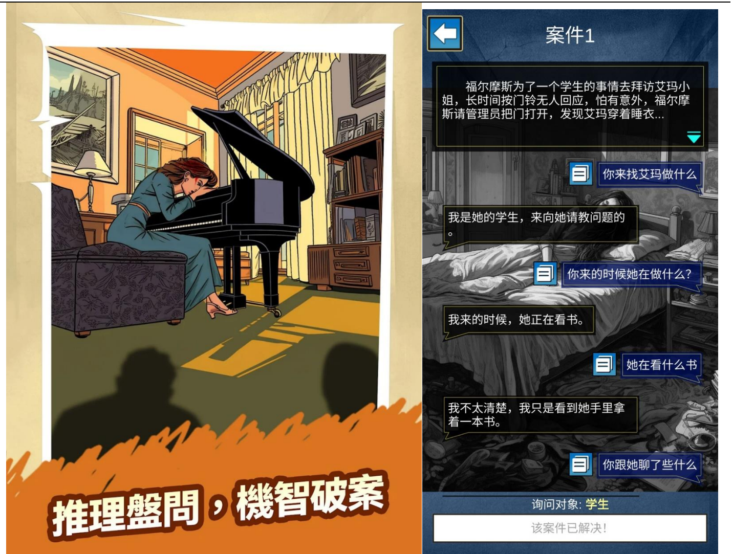
图表 1 紫天科技 AI 游戏《大侦探智斗小 AI》