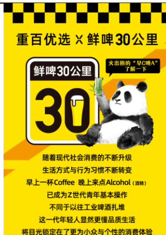
图 3：“鲜啤 30 公里” 联名重百优选