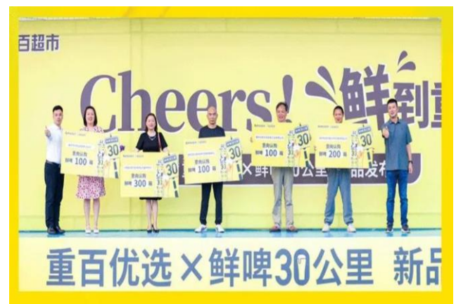
图 4：“鲜啤 30 公里” 与重百开启战略合作