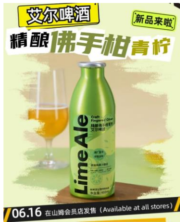
图 1：“鲜啤 30 公里” 登入山姆会员店