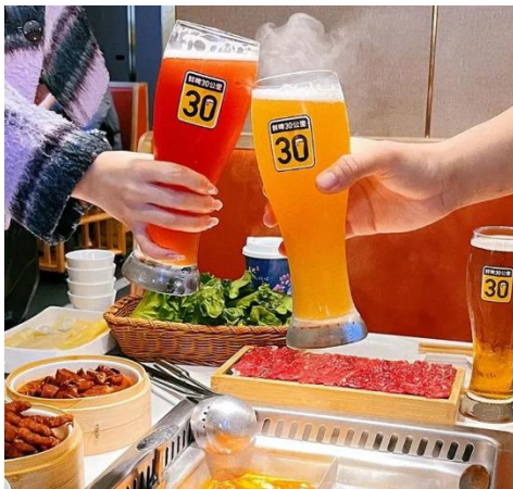
图 7：“鲜啤 30 公里”入驻巴邑火锅