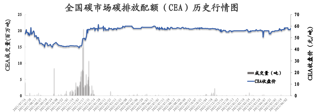
图1: 全国碳市场碳排放配额（CEA）行情

全国碳市场碳排放配额（CEA）挂牌协议交易成交量 1,000 吨，成交额 57,500.00 元，开盘价 57.50 元/吨，最高价 57.50 元/吨，最低价 57.50 元/吨，收盘价 57.50 元/吨，收盘价较前一日上涨 0.17%。无大宗协议交易。全国碳排放配额（CEA）总成交量 1,000 吨，总成交额 57,500.00 元。全国碳市场碳排放配额（CEA）累计成交量 237,188,715 吨，累计成交额 10,882,228,249.85 元。