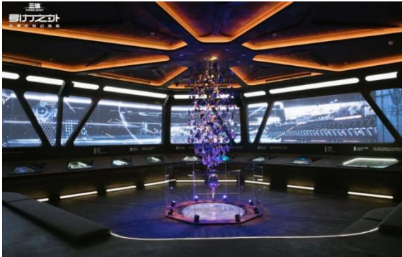
图 6：三体线下体验馆

三体宇宙对游族网络全资子公司游族互娱进行授权，游族互娱拥有《三体》三部曲 3 款游戏的开发与发行权，授权期为 2020 年 6 月至 2030 年 6 月。目前，游族网络正在进行《三体》IP 游戏开发，对应产品代号 3T (1-3)，我们预计将于未来 3-5 年陆续推向市场。目前，游族网络已经开发了几款较成熟的卡牌、SLG、MMO 产品（少年三国志、权力的游戏、新盗墓笔记等）高知名度 IP 的加持下，新游上线后有望为公司提供营收增量。