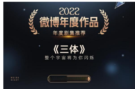
图3：《三体》电视剧获2022微博年度作品