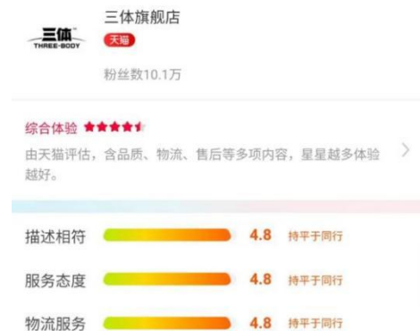
图5：三体天猫旗舰店