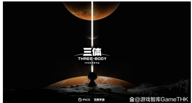
图 7：三体 PICO 4 游戏概念图