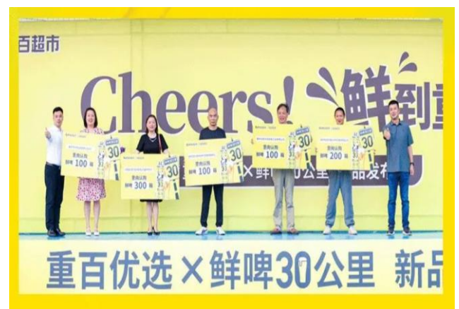
图 4：“鲜啤30公里”与重百开启战略合作