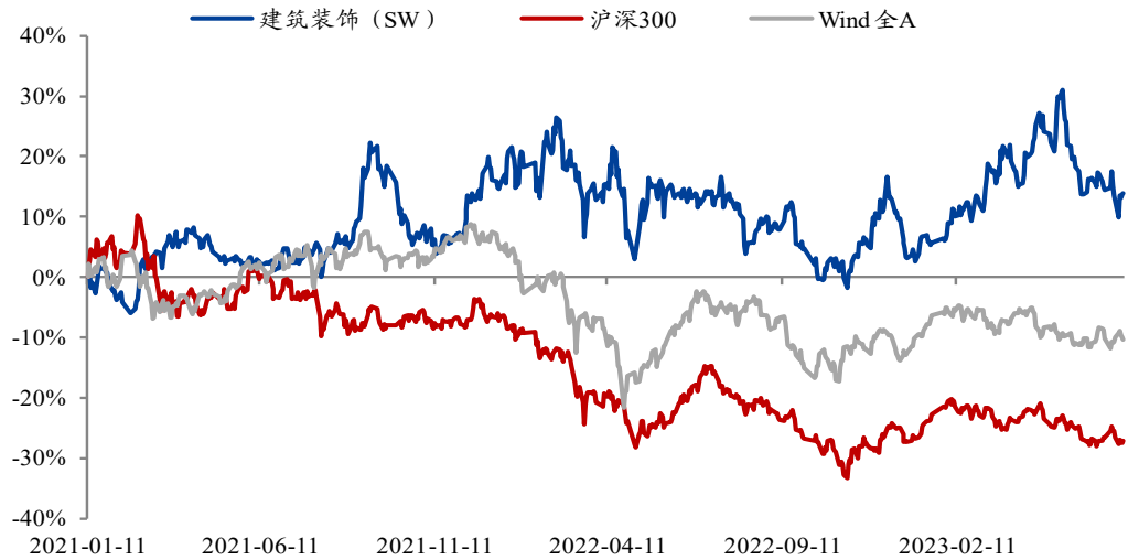
图1: 建筑板块走势与 Wind 全 A 和沪深 300 对比（2021 年以来涨跌幅）

个股方面，*ST 全筑、ST 广田、富煌钢构、中钢国际、中工国际位列涨幅榜前五，风语筑、北方国际、龙元建设、华建集团、中铁装配位列涨幅榜后五。