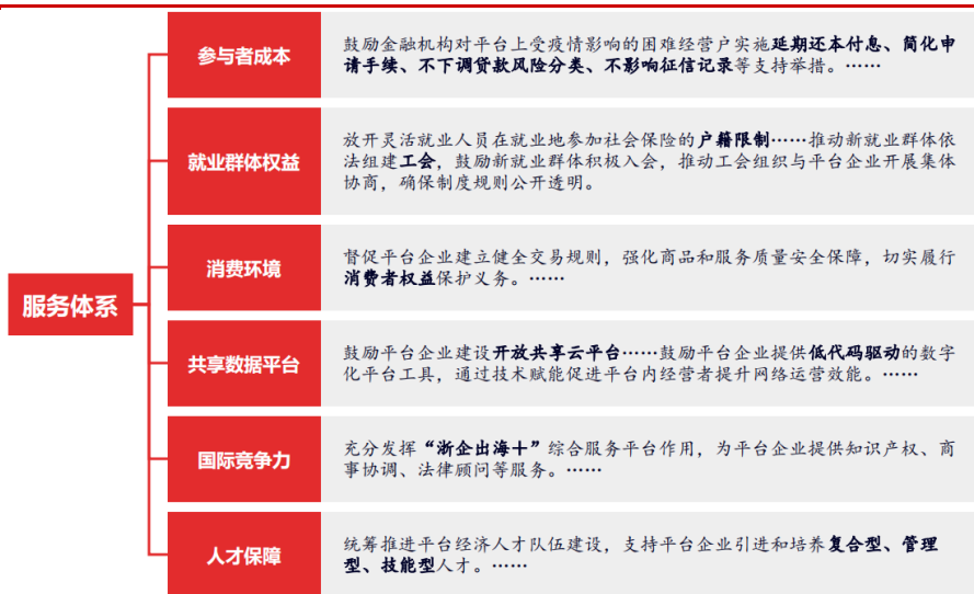
图 3 持续优化发展环境，着力构建精准高效的服务体系

服务体系：重点聚焦降低参与者经营成本、保障就业权益、优化网络消费环境等方面。 《实施意见》提到鼓励金融机构对平台上暂时受困的小微企业、个体工商户提供 融资担保服务 ， 落实小微企业所得税优惠政策 ；引导平台企业依法合规用工， 依法依规与劳动者订立劳动合同或者书面协议，支持符合条件的新就业形态劳动者按规定参加职工基本养老、工伤、医疗保险 ；督促平台企业建立健全交易规则，强化商品和服务质量安全保障， 切实履行消费者权益保护义务完善多元化消费纠纷解决机制 ，创新网络消费维权模式，提高网络纠纷处理效能。