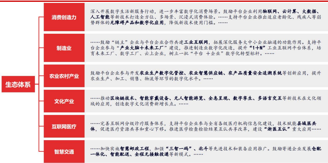
图 2 赋能经济转型升级，着力构建多元融合的生态体系