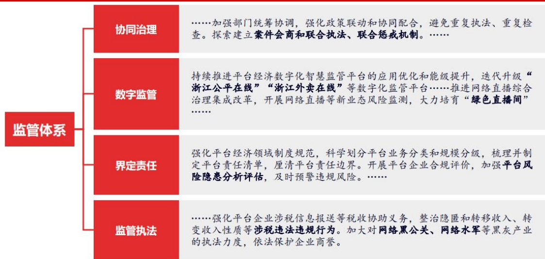
图 5 加快平台治理创新，着力构建高效协同的监管体系