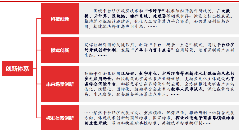
图 1 增强创新发展动能，着力构建更具活力的创新体系