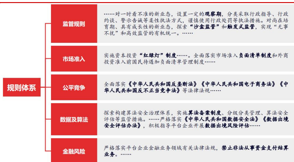
图 4 健全完善监管制度，着力构建公平透明的规则体系

数据及算法规则方面：探索构建算法安全治理体系，实施算法备案制度、分级分类管理、算法安全评估等监管措施。严格落实《中华人民共和国数据安全法》《数据出境安全评估办法》， 积极指导平台企业开展数据出境风险评估，强化数据出境监测预警。