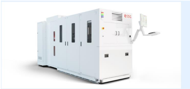
图 2：公司 8 英寸单片式碳化硅外延设备示意图