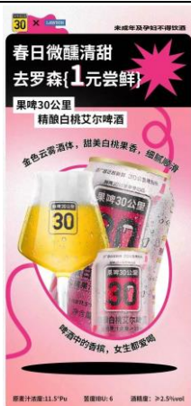
图 7：“鲜啤 30 公里”入驻罗森便利店