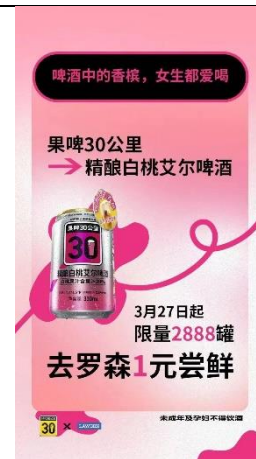
图 8：“鲜啤 30 公里”入驻罗森便利店