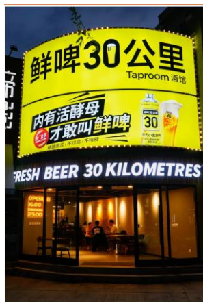
图 1：沈阳鲜啤 30 公里小酒馆