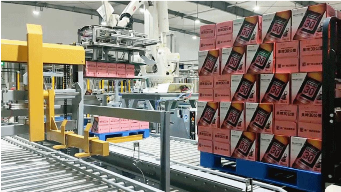
图 11：长沙鲜啤 30 公里酒厂