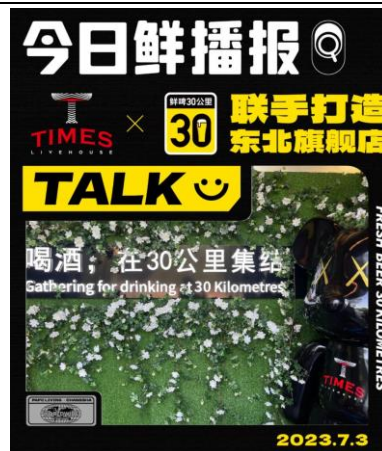
图 2：TIMES LIVE HOUSE & 鲜啤 30 公里东北首家旗舰店