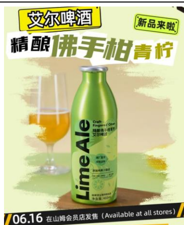
图 3：“鲜啤 30 公里” 登入山姆会员店