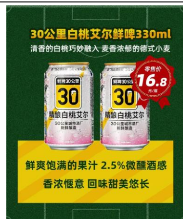
图 10：“鲜啤 30 公里”入驻新佳宜