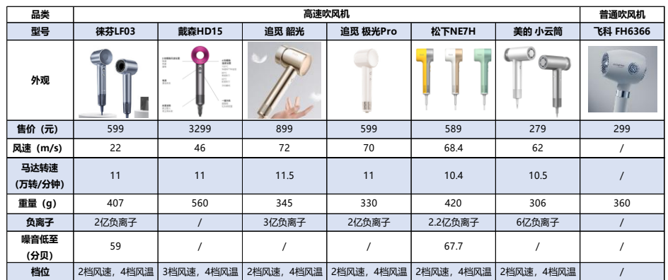
表 1：热门吹风机参数对比

根据飞科电器京东官方旗舰店商品页，目前店铺在售共有五款吹风机产品，价格分布在79-299元之间，其中不包含高速吹风机。而目前市面上几款较火爆的高速吹风机产品，例如戴森、徕芬LF03、追觅极光Pro等，售价多数在五百元以上，至高可达三千元以上。因此我们认为此次高速吹风机新品的发布将助力飞科丰富在吹风机领域产品线，有望显著提升产品结构及毛利率水平。