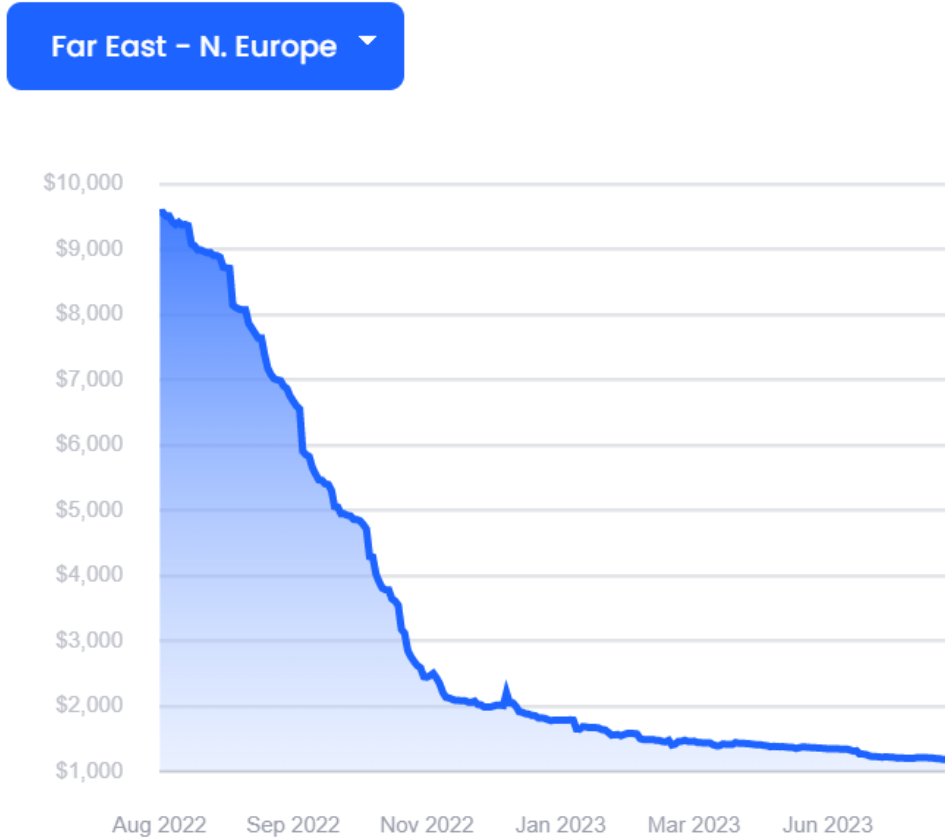
图 1-1：远东→北欧航线运价

根据 XSI-C 最新集装箱运价指数显示，7 月 26 日远东→欧洲航线录得$1186/FEU，较昨日下跌$2/FEU，日环比下跌 0.17%，周环比下跌 1.08%。