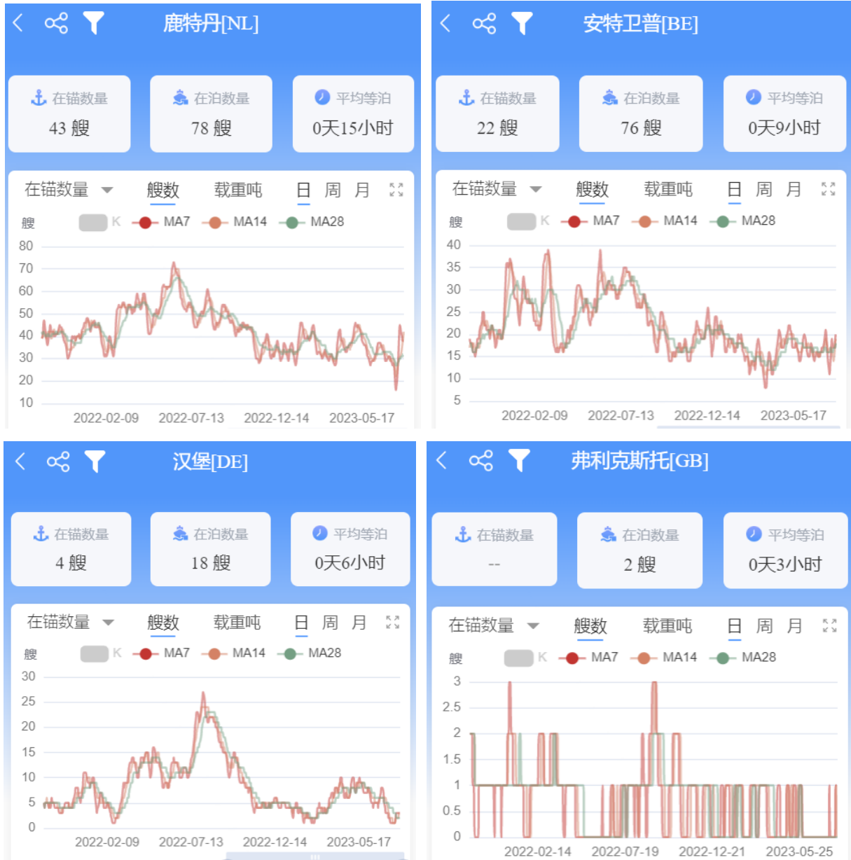
图 2-4：四大北欧基本港在港数量、在锚数量、在泊数量、平均等泊时间