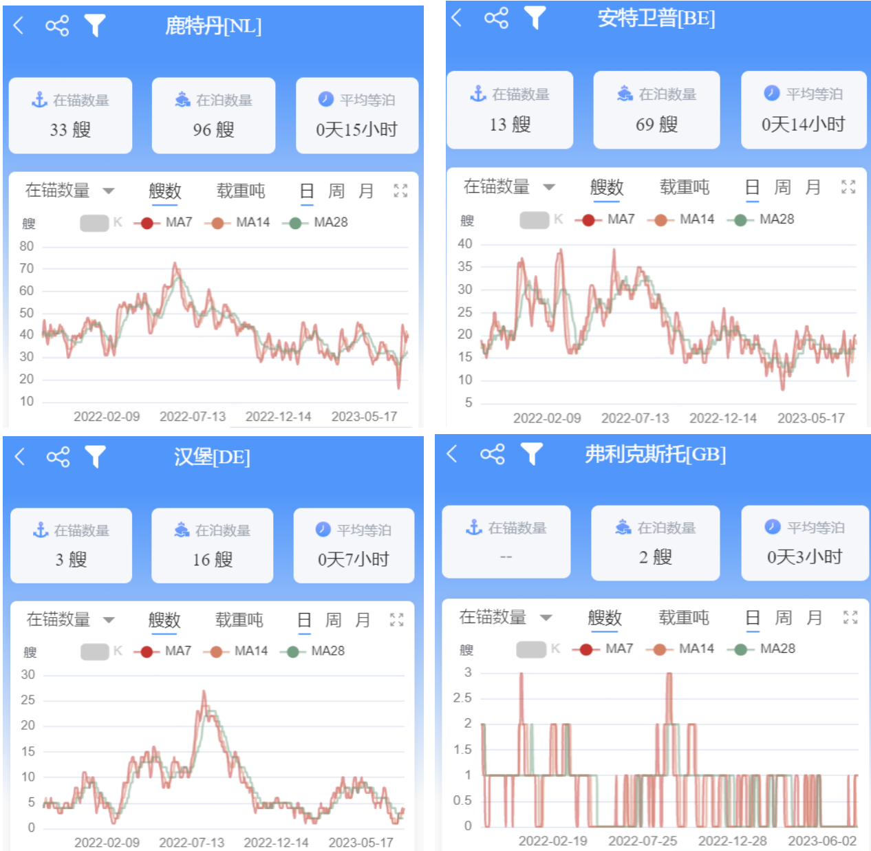
图 3-4：四大北欧基本港在港数量、在锚数量、在泊数量、平均等泊时间