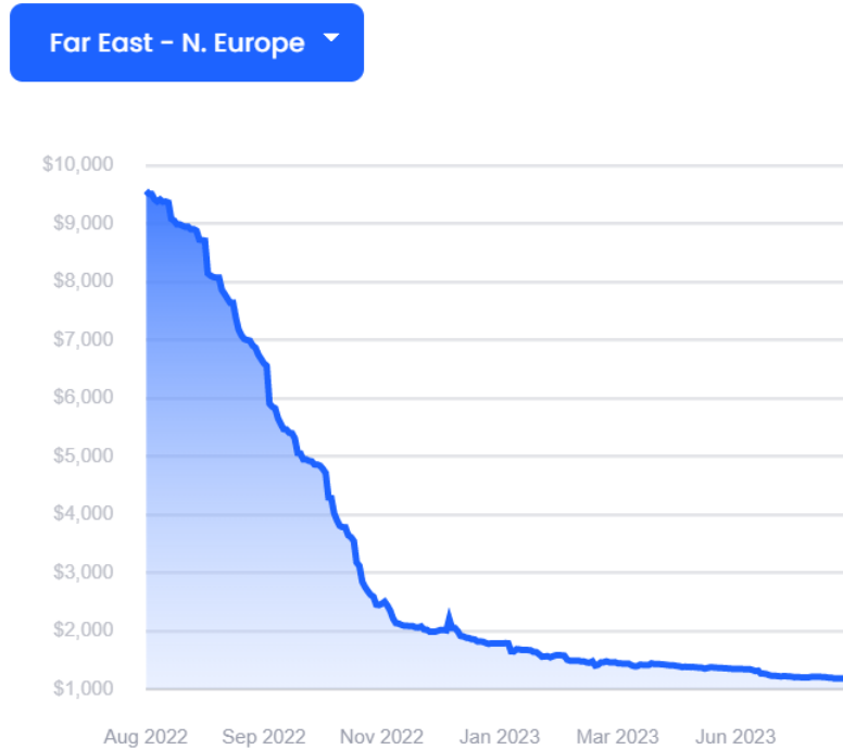
图 1-1：远东→北欧航线运价

根据 XSI-C 最新集装箱运价指数显示，7 月 31 日远东→欧洲航线录得$1195/FEU，较昨日上涨$8/FEU，日环比和周环比上涨 0.67%。