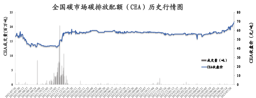
图1: 全国碳市场碳排放配额 (CEA) 行情

全国碳市场碳排放配额 (CEA) 挂牌协议交易成交量 68,160 吨, 成交额 4,630,040.00 元, 开盘价 67.80 元/吨, 最高价 69.00 元/吨, 最低价 67.80 元/吨, 收盘价 67.93 元/吨, 收盘价较前一日上涨 1.39%。大宗协议交易成交量 240,000 吨, 成交额 16,080,000.00 元。今日全国碳排放配额 (CEA) 总成交量 308,160 吨, 总成交额 20,710,040.00 元。截至 8 月 9 日, 全国碳市场碳排放配额 (CEA) 累计成交量 241,753,144 吨, 累计成交额 11,145,812,914.51 元。