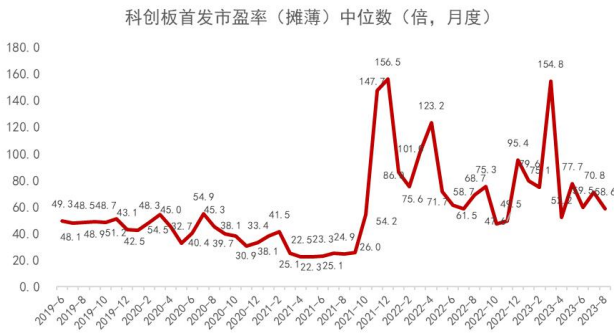
图 2：科创板首发 PE（摊薄）月度中位数