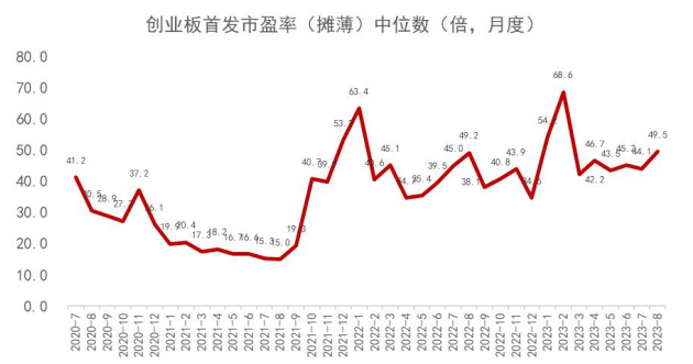
图 5：创业板首发 PE（摊薄）月度中位数