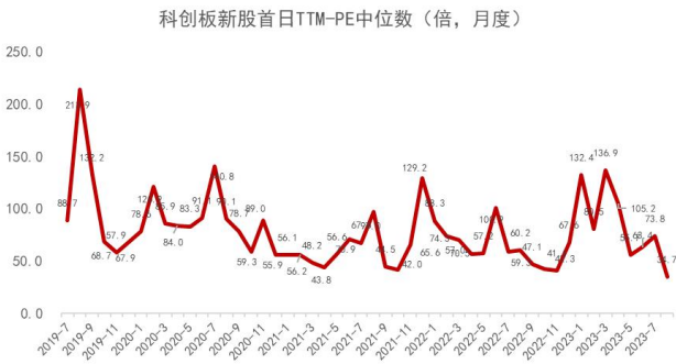
图 4：科创板新股首日开板估值水平变化