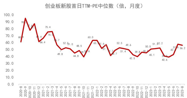
图 7：创业板新股首日开板估值水平变化