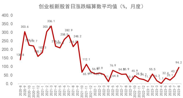
图 6：创业板新股首日涨幅月度均值变化趋势

截至周五(2023/08/11)，创业板 8 月份首发 PE（摊薄）49.5 倍(之前一周 61.28 倍)，较 7 月份(44.05 倍)上升；创业板 8 月份新股首日涨幅 94.18%(之前一周 27.4%)，较 7 月份(43.21%)上升；创业板 8 月份新股首日开板估值（TTM-PE，月度中位数）56.24 倍(之前一周 36.38 倍)，较 7 月份(57.58 倍)下降。