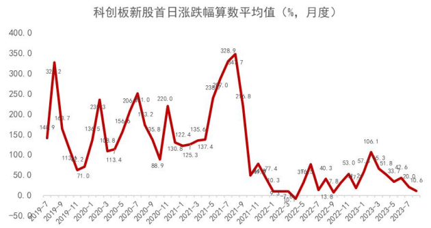
图 3：科创板新股首日涨幅月度均值变化趋势