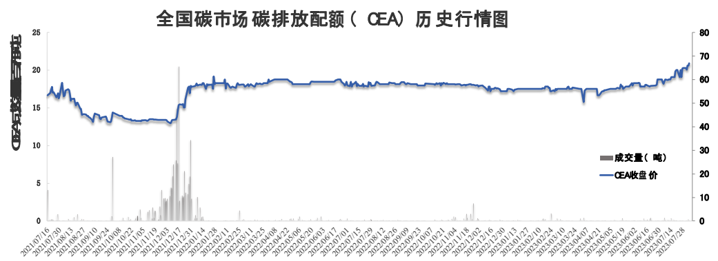
图1：全国碳市场碳排放配额（CEA）行情

今日全国碳市场碳排放配额（CEA）挂牌协议交易成交量 82,112 吨，成交额 5,610,732.00 元，开盘价 67.10 元/吨，最高价 71.00 元/吨，最低价 67.10 元/吨，收盘价 68.33 元/吨，收盘价较前一日下跌 2.25%。今日大宗协议交易成交量 400,000 吨，成交额 20,800,000.00 元。今日全国碳排放配额（CEA）总成交量 482,112 吨，总成交额 26,410,732.00 元。截至 8 月 14 日，全国碳市场碳排放配额（CEA）累计成交量 242,526,490 吨，累计成交额 11,191,818,359.01 元。