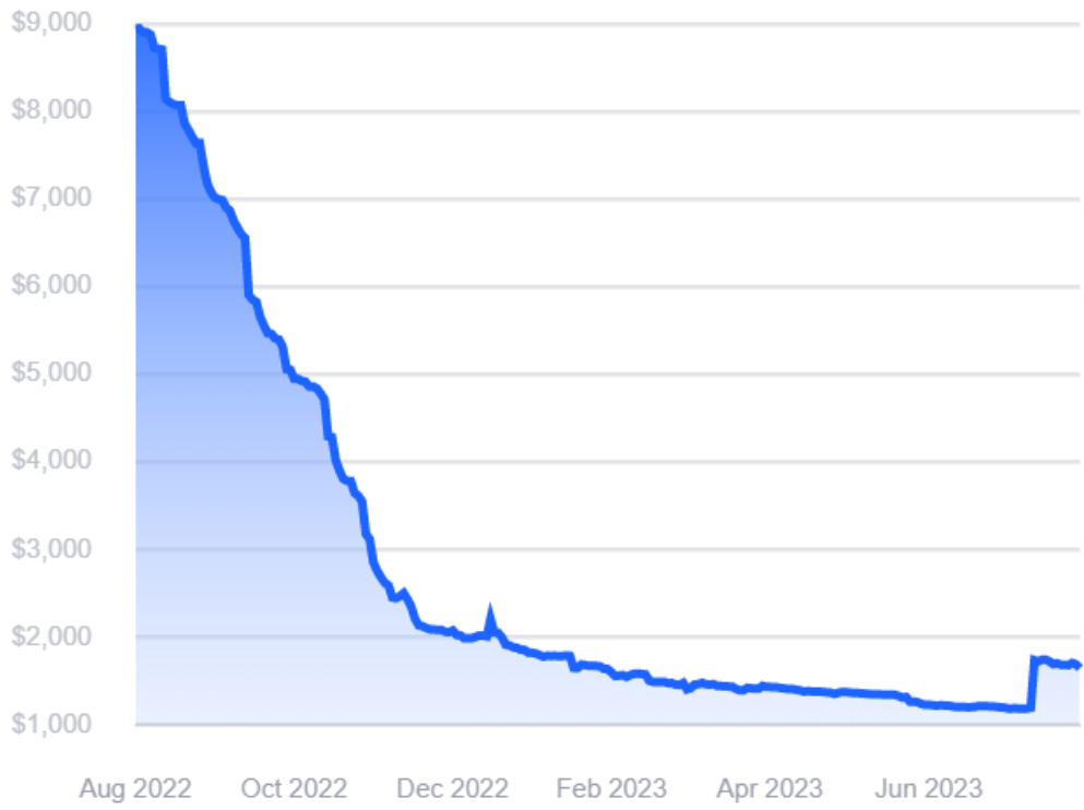
图 1-1: 远东→北欧航线运价