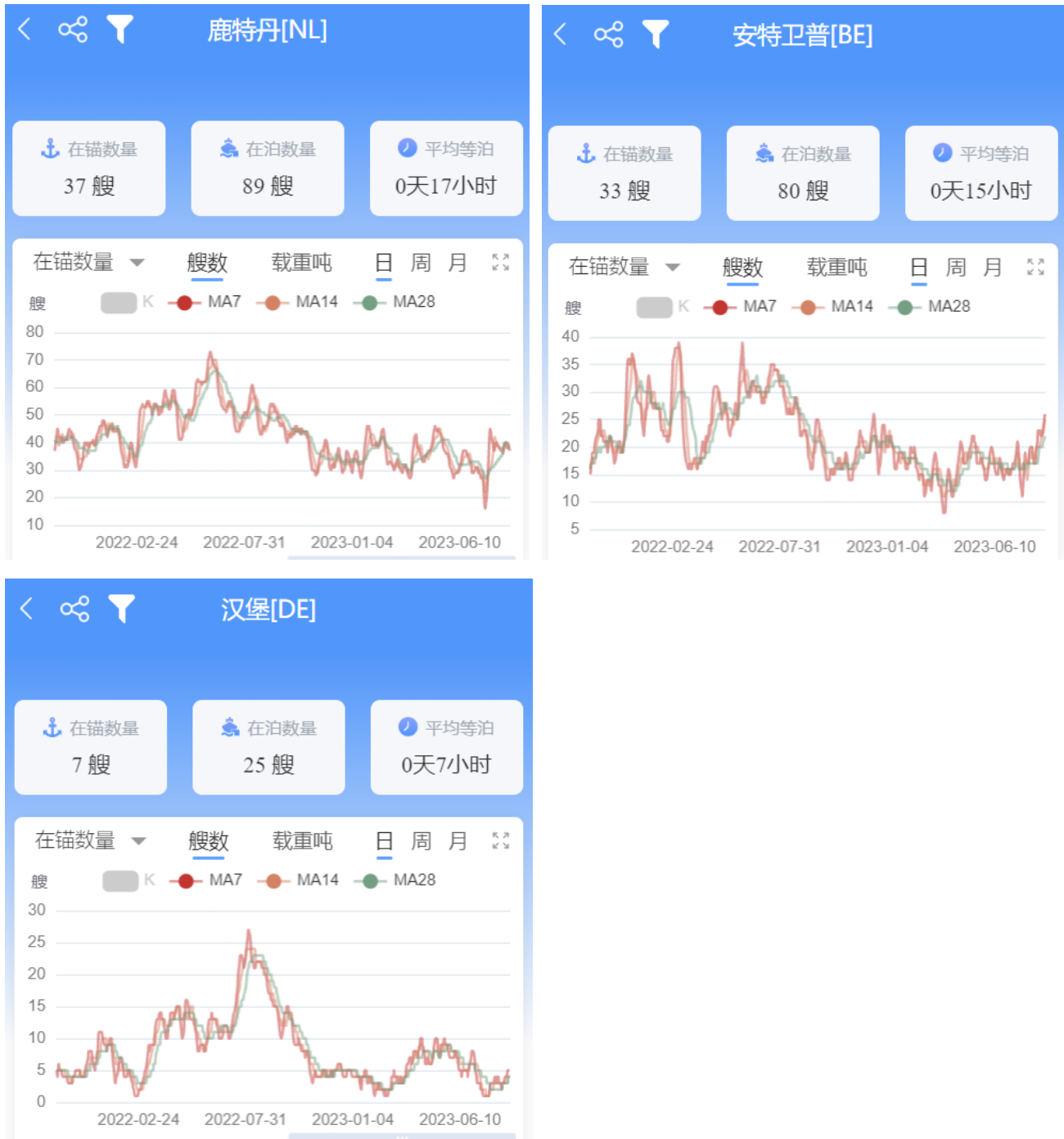
图 3-4：北欧基本港在港数量、在锚数量、在泊数量、平均等泊时间