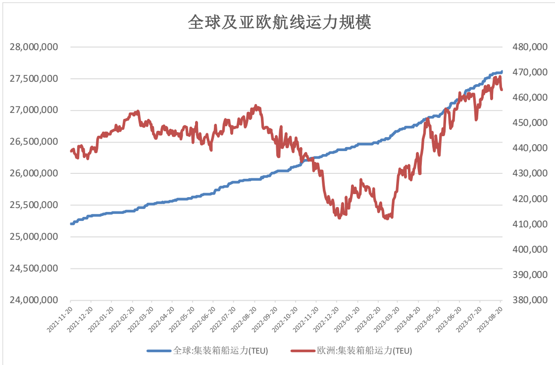
图 1-2: 全球及亚欧航线集运市场运力规模