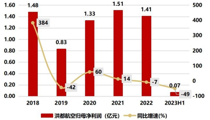
图2: 2023H1 实现归母净利润 0.07 亿元, 同比减少 48.81%