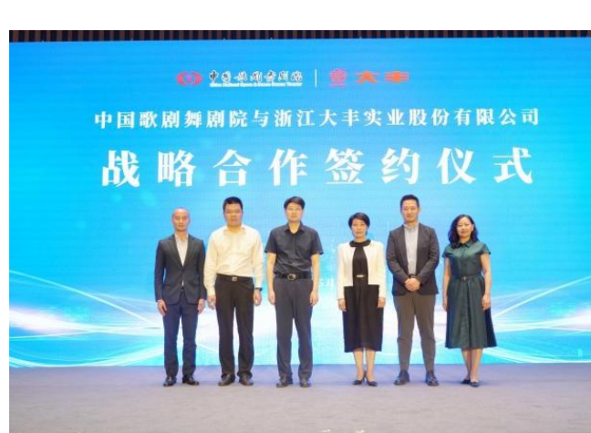
图 10：与中国歌剧舞剧院签署战略合作协议