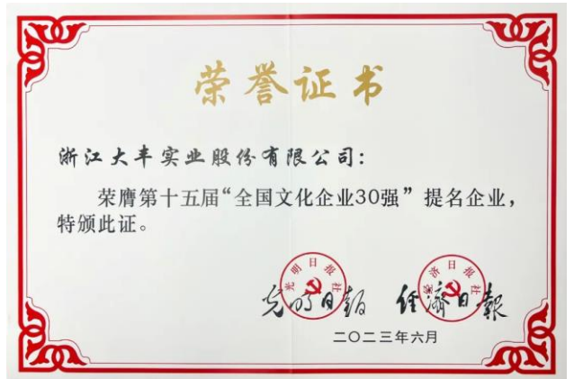
图 6: 大丰再获“全国文化企业30强”提名