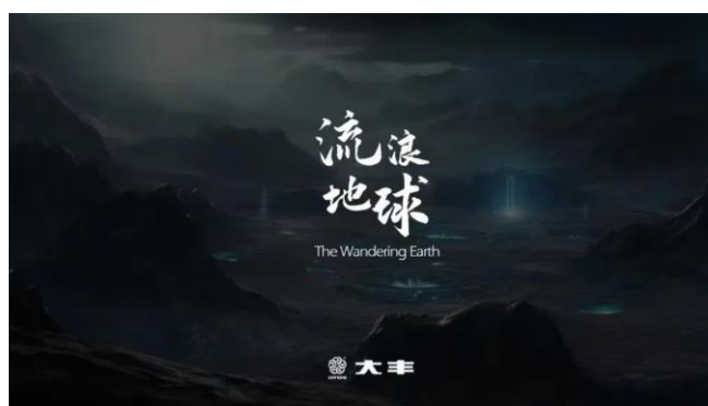
图 13：大丰文化牵手《流浪地球》

基于大丰在文体旅领域的全产业链竞争优势，《流浪地球》牵手大丰文化瞄准泛娱乐市场，力图将人文精神和审美追求融入泛娱乐产品开发中，挖掘细分市场对艺术审美的个性化需求，做到对创作内容精确定制、对传播对象精准滴灌，通过创意和科技传递文化薪火、弘扬人文精神。