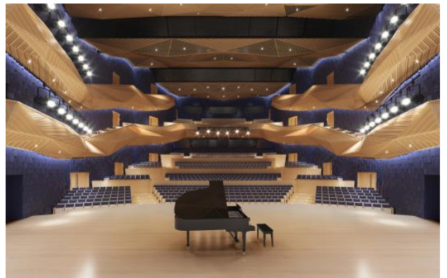
图 2：索契天狼星剧院和音乐厅综合体项目主厅效果图