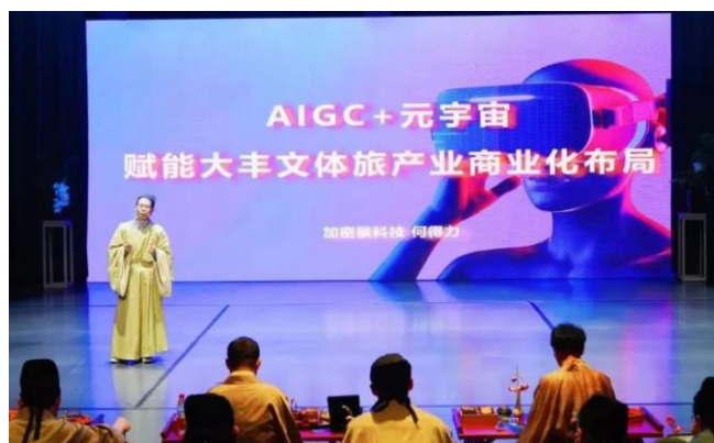
图 11：新商业战略发布及合作伙伴分享

活动现场，大丰正式发布以科技驱动的新商业布局和路线图，通过整合各方资源、协同发展产业链条，聚焦新场景和产业应用融合。在本次发布会上，大丰还举行了文体旅新商业产业研究院筹建启动仪式，此举在推动文体旅产业融合方面具有重要意义。发布会展示了大丰在人工智能等新技术变革背景下的战略布局，彰显了公司紧随全球数字经济大潮、践行国家“文化自信”的决心和能力。