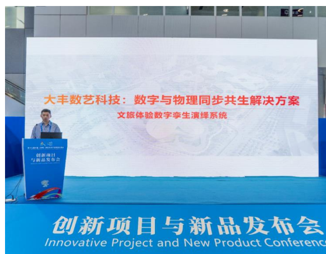
图 8：大丰多媒体数字孪生控制系统重磅发布