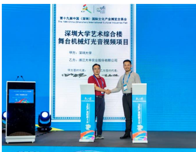
图 7：深圳大学与大丰实业就深圳大学艺术综合楼项目签约

大丰在文博会上发布了全新产品——大丰多媒体数字孪生控制系统。此次上线的大丰多媒体数字孪生控制系统，通过应用数字孪生技术，是一种基于三维模型渲染数字孪生的多媒体交互制作方法及装置，包括了服务器硬件设备集成。