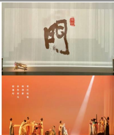
图 15：舞剧《門》全国巡演正式开始

3月31日，大丰文化全国巡演总代理项目——《蝶变》亮相深圳华润万象天地剧场，正式开启原创民国悬疑音乐剧《蝶变》全国巡演的第一站。民国悬疑音乐剧《蝶变》，微博话题1300万阅读次数，大麦评分9.1/豆瓣评分8.2，上海大剧院2轮，25场，场场售罄。