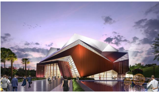
图 1：索契天狼星剧院和音乐厅综合体项目效果图

索契天狼星剧院和音乐厅综合体包括 1200 座主厅，可用作音乐厅兼剧院，通过一体式返声板及智能舞台的切换，满足古典乐、音乐剧、芭蕾等演出需求。300 座多功能厅是一个黑匣子剧场，用于音乐会、芭蕾舞、歌剧等演出。