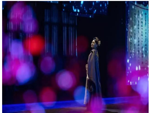
图 4: 大丰四大节目入选开闭幕式资源库