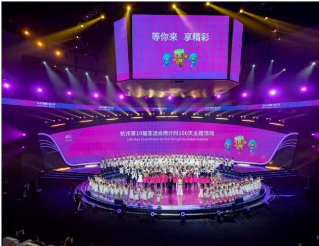
图 3: 大丰受邀出席杭州第19届亚运会倒计时100天主题活动