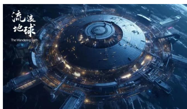
图 14：大丰文化牵手《流浪地球》