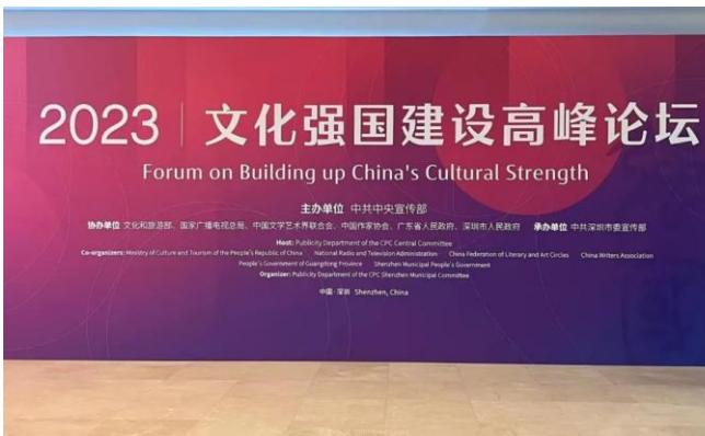
图 5: 文化强国建设高峰论坛

随后由光明日报社和经济日报社发布第十五届“全国文化企业 30 强”。大丰实业董事、副总经理丰嘉隆受邀参加文化强国建设高峰论坛并参加“全国文化企业 30 强”发布会。大丰再获“全国文化企业 30 强”提名企业。