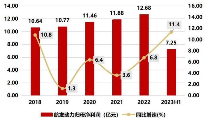
图2：2023H1 实现归母净利润 7.25 亿元，同比增长 11.35%