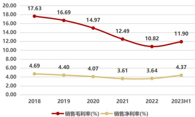
图3：2023H1 毛利率为 11.90%，净利率为 4.37%