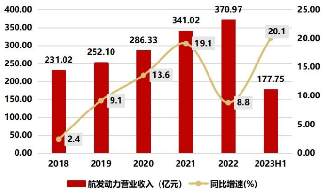
图1：2023H1 实现营业收入 177.75 亿元，同比增长 20.05%