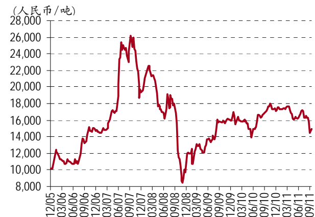
图表 1. 铅