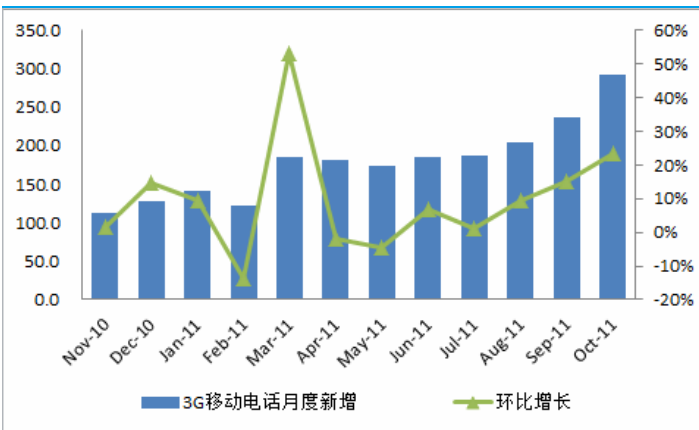
图表1：3G 用户月度新增及环比（单位：万户）