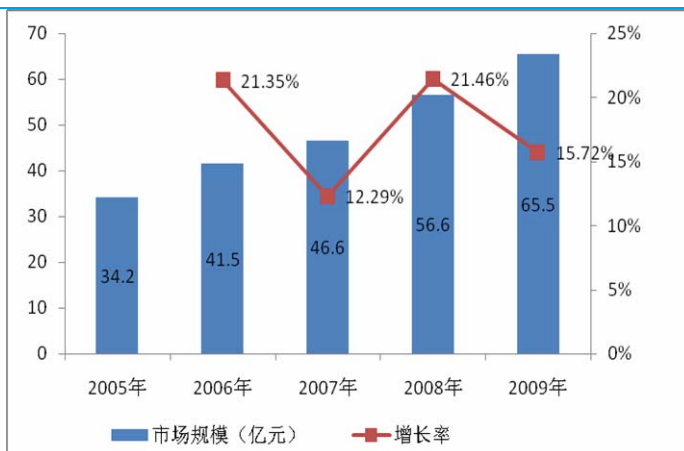
图表1: 皮肤科用药领域市场规模