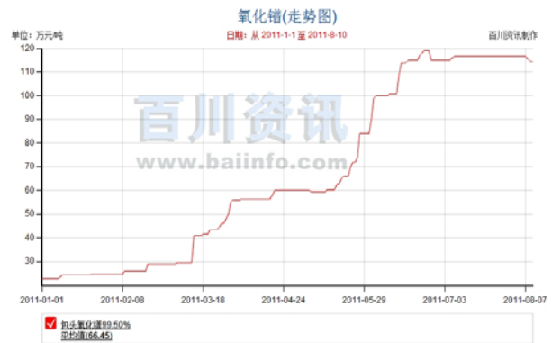
图表 2 今年以来氧化镨价格走势