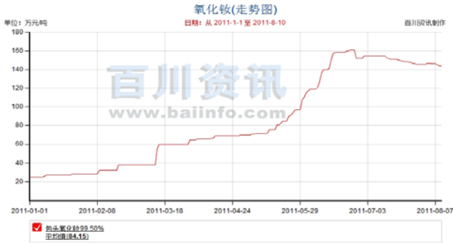
图表 1 今年以来氧化钕价格走势

那些已经用完生产配额的企业以及一些黑矿山将会极大的威慑作用，我们预计下半年全国稀土（尤其重稀土）产量会明显减少，2011年全国稀土氧化物产量可能会低于2010年13.25万吨的水平，这将导致稀土供需缺口进一步扩大，我们对未来稀土价格依然持乐观态度。