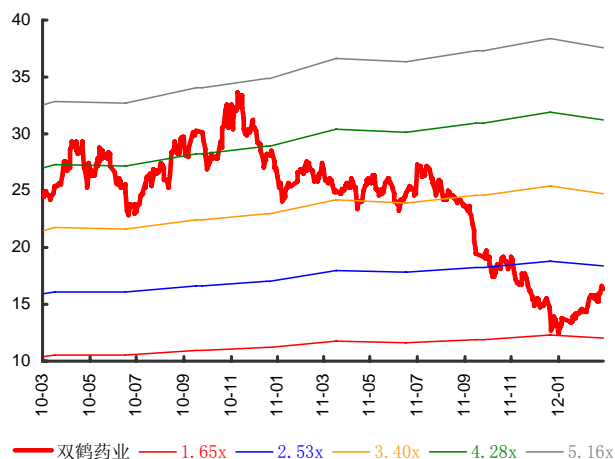
图表 3: 双鹤药业历史 PB Band