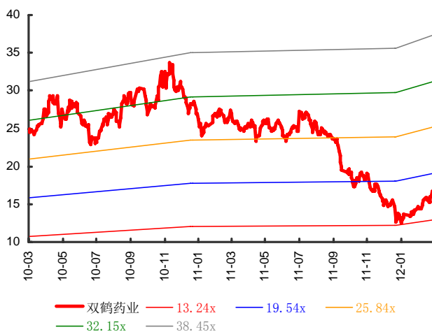
图表 2: 双鹤药业历史 PE Band