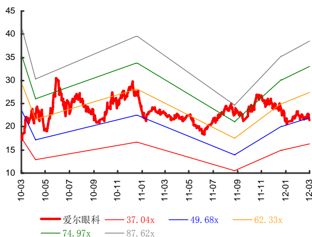
图表 2：爱尔眼科历史 PE Band