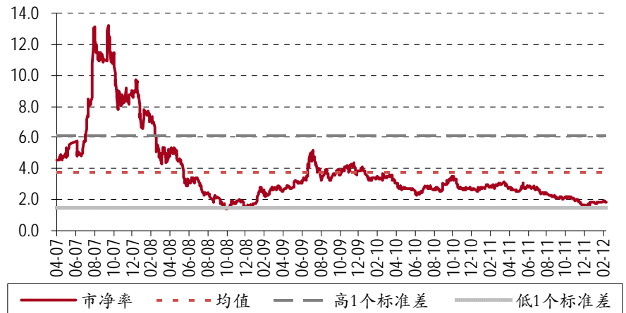
图表 3. 市净率区间 - 中国铝业(A股)