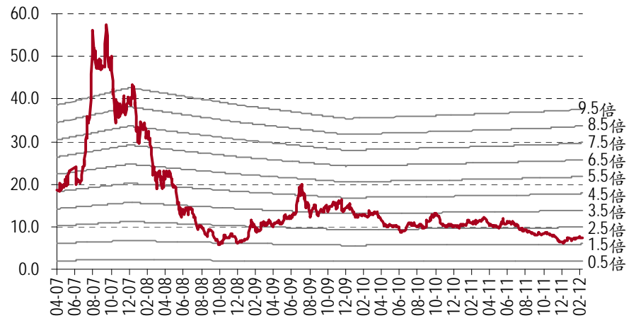
图表 4. 历史市净率 - 中国铝业(A股)