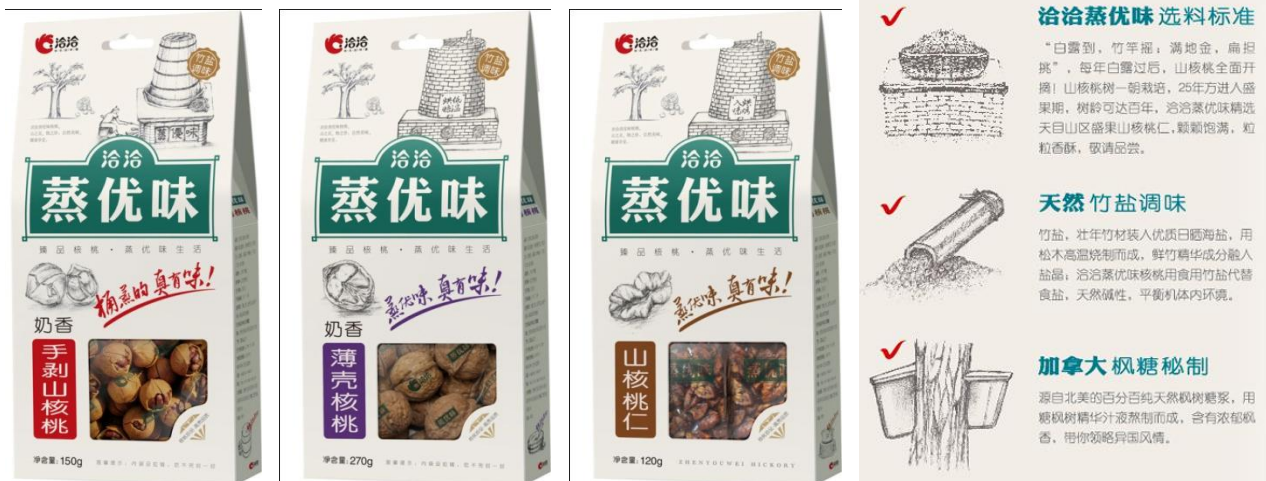
图 1 新产品“蒸优味”核桃

注：山核桃仁终端价 55 元/120g 促销价 46 元/120g；手剥山核桃终端价 42 元/150g 促销价 31 元/150g；薄壳核桃终端价 36 元/200g 促销价 30 元/200g，资料来源：中投证券研究所