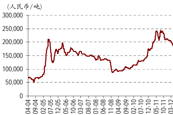
图表 1.APT 价格

我们预计公司营收增长主要来自于今年1季度公司主要产品 APT、碳化钨粉及氧化钨等均价较 2011 年同期分别上涨 4.2%、9.9%和 13.2%。