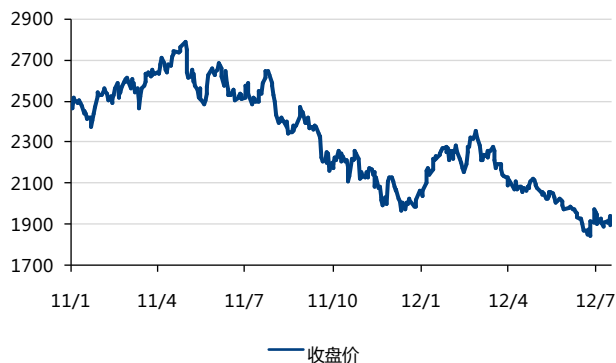
图 2：LME 金属铝价格走势