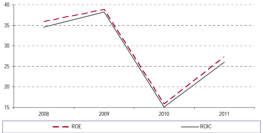
图表 3.ROE 和 ROIC 情况