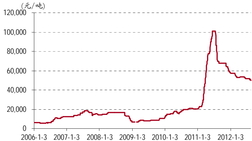
图表 1. 混合碳酸稀土价格

总的来说, 今年各类稀土产品价格基本处于一路下滑的通道。纵然稀土行业政策不断落地, 但全球经济疲软带来的需求孱弱依然决定了上半年稀土价格并未因政策涌现而重现 2010 年的盛世。这也是公司业绩逐季回落的主要原因。此外 1 季度可能有部分业绩来自于一次性的收储。