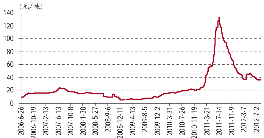
图表 2. 氧化镨钕