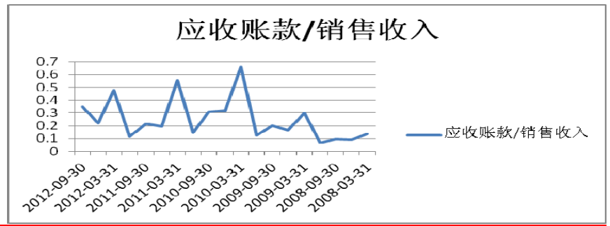
图 1: 应收账款/销售收入