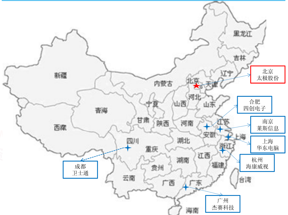
图表 2：太极是中国电科集团在高端软件与服务百亿战略目标的承接者